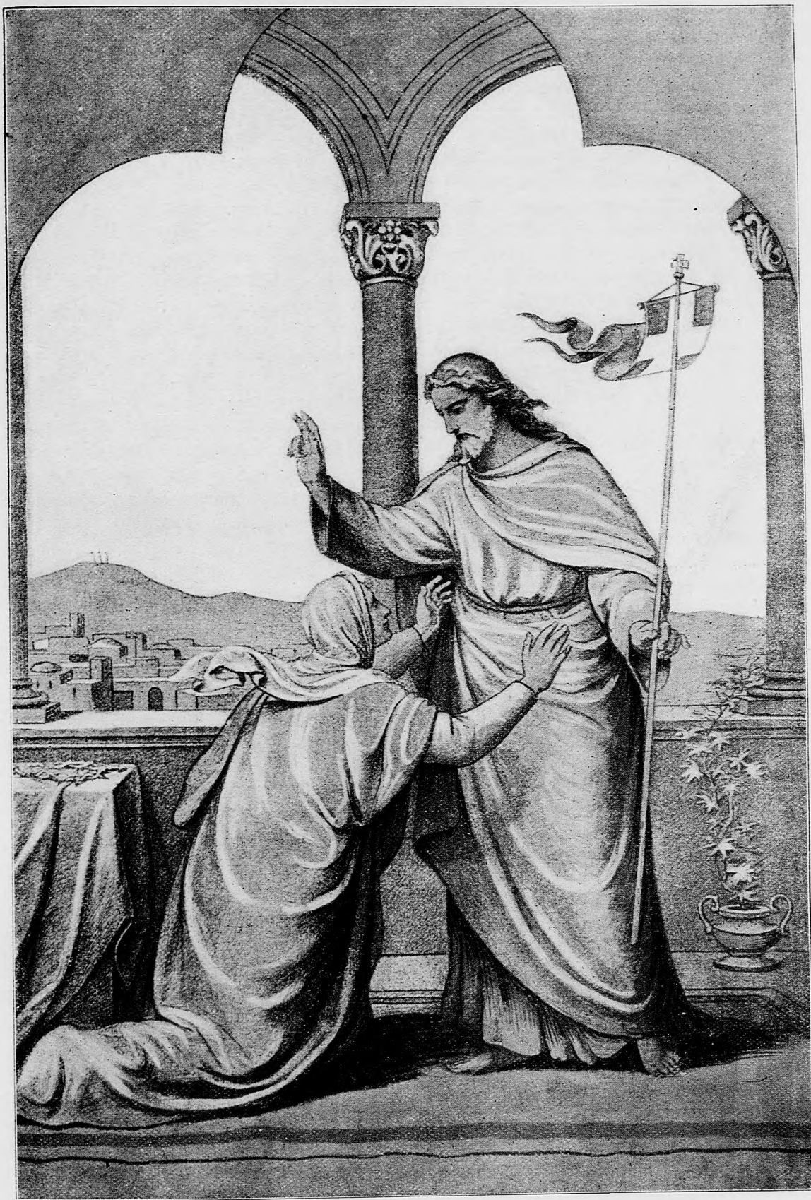
Z mrtvých povstavši Spasitel' zjavi sa Marii Magdalene.