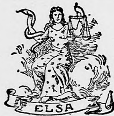
Zák. zazn. Ochranná známka

Opravdový Fellerov «Elsa-Fluid» musí na všetkých návodoch o upotrebení a na každej fliaši takú ochrannú známku mať, ako je tu vyobrazená, s menom «Elsa» a podpisom «Feller». Liek je od zdravotnej vrchnosti preskúmaný a одобrený. Na výstavách v Paríži, Ríme, Londíne, Nizza a Berlíne Fellerov «Elsa-Fluid» vyznačený bol zlatou medajlou,