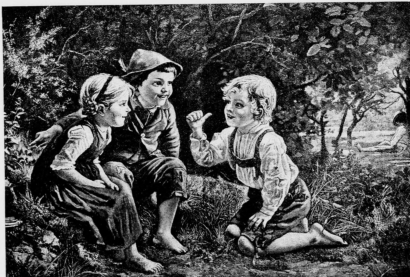
Mladost v mladej prírode.

Každý výborník prisahu skladá, že popis prisne, dľa zákona, a nie dľa svojej vôle konať bude. Pravda prisaha táto liberálna je. Nie pred Bohom v kostole ju skladajú, ale pred slúžnym, a jaký slúžny taká prisaha. A tak popis dľa nariadenia slúžneho sa prevádza. Že akým spôsobom, o tom svedčia ponosy, ktoré zo všech strán