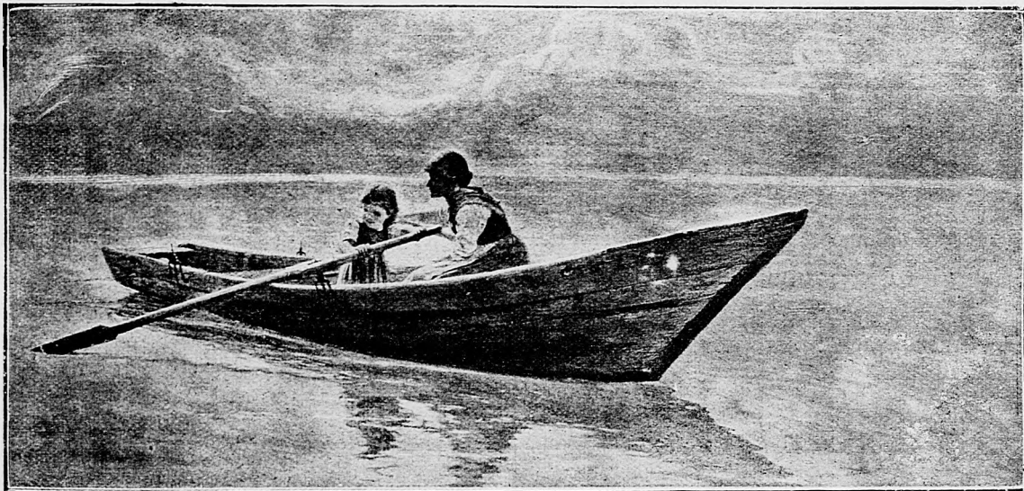
Návrat do domu.

Ten zákon o úžere je totiž taký ledajaký, že ho bársktorý kozkár-žid ľahko môže obísť a súd nemá sa načo opref ešte ani v takých pádoch,