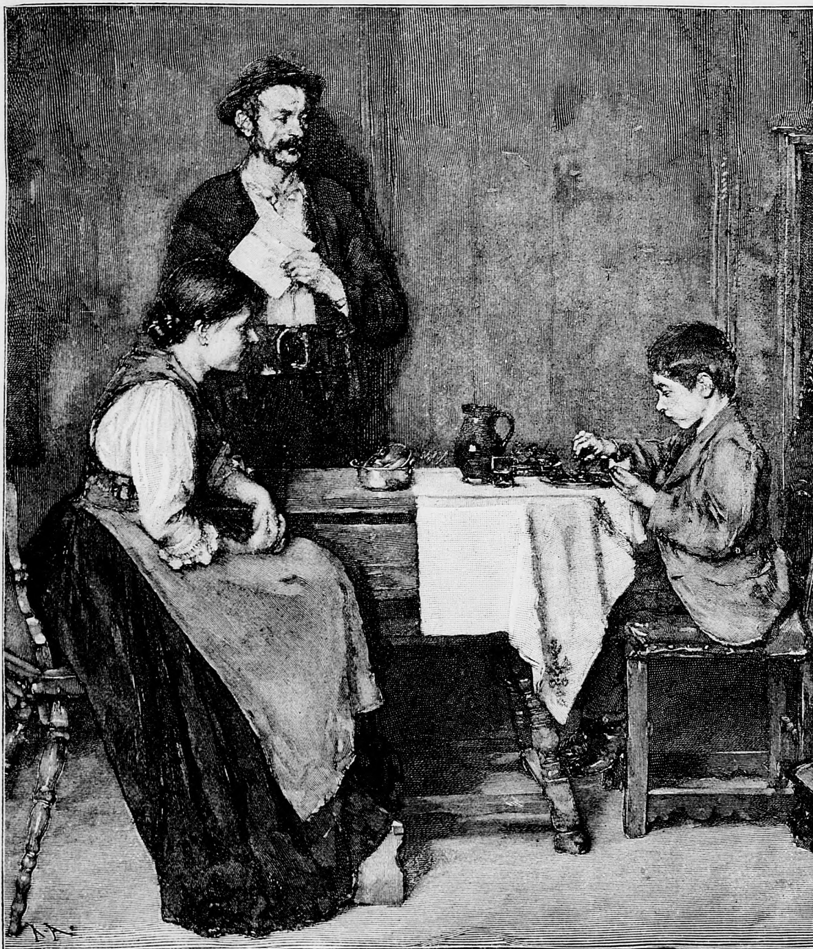
Na prázdninách obaračky.

sem sa majú posielat' predplatky, jako dopisy do novin ohlásky a náhodné reklamácie. Cena jedneho 5 stĺpcového malého riadku je 20 hl. Rukopisy sa naspak nedávajú.