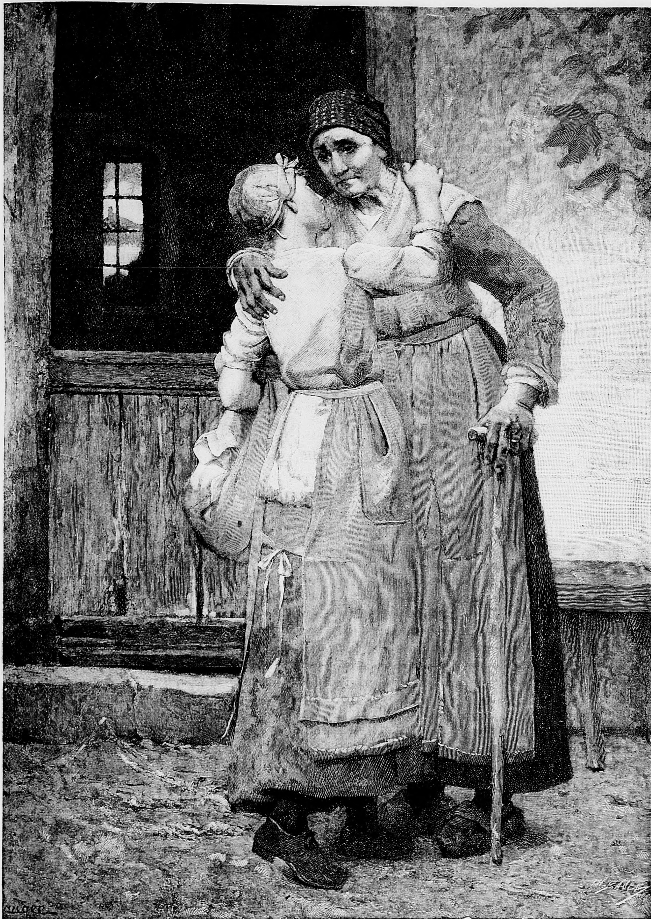
Rozlúčka s milou matkou.