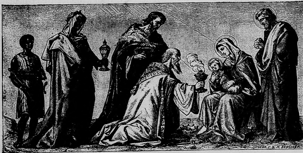
Poklona kráľov od východu.