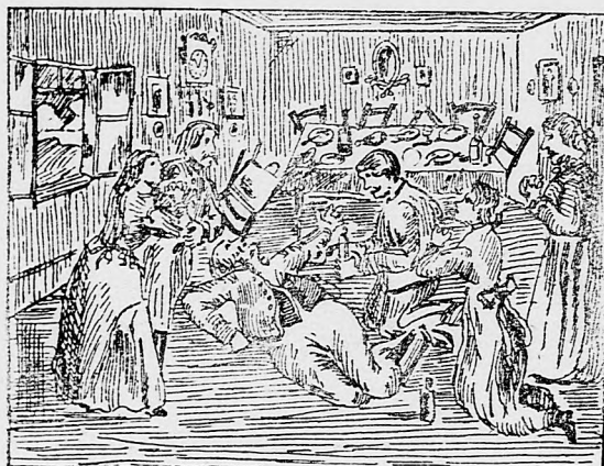
Mój dobrý priateľ hneď otvoril oči a šeptal: «Ešte, ešte!»