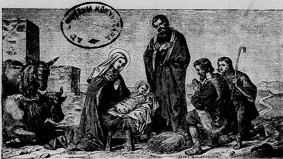
Pastieri sa modlia k malému Ježiškovi.

Uzná, že volebný zákon nezodpovedá terajším pomerom, najmä votizáciu posudzuje, pri ktorej —