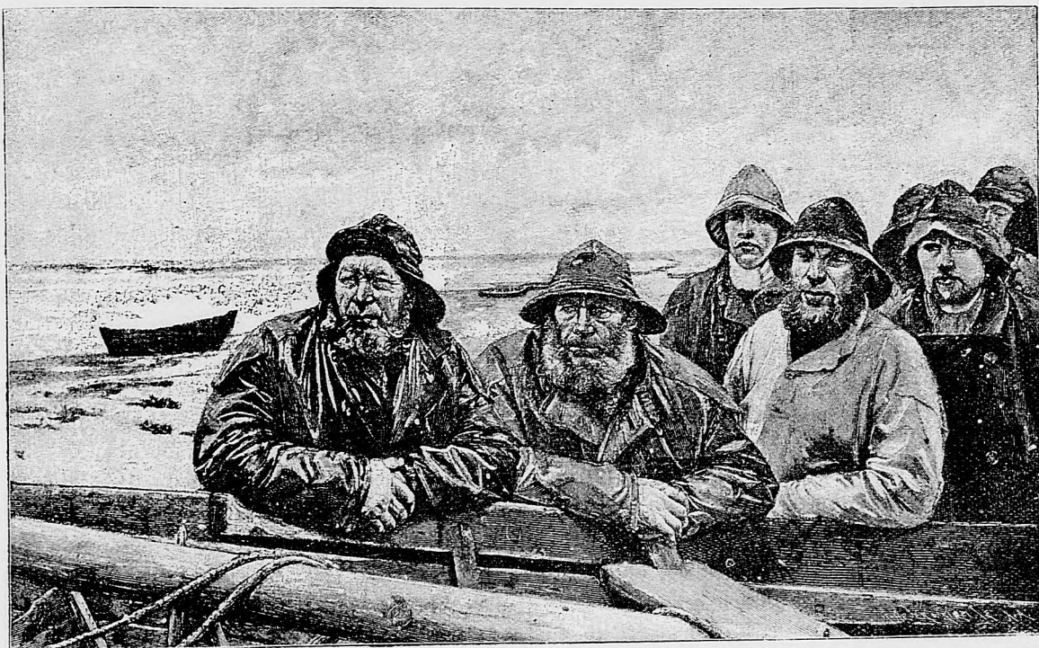
Víchrom otužení námorníci.

Z Račidorfu. Hľadáme dobrého kolárskeho majstra,