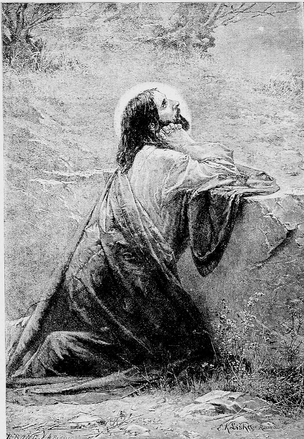
Ježiš na hore Olivetskej.

To už len vidí každý, že národ niako nevie sa uspokojiť s tými novými farchami vojenskými — len liberáli robia tak, akoby tú nevôlu národa nevideli. Oni sa zopreli ako nepodarený kôň, ktorý sa z miesta pohnúť