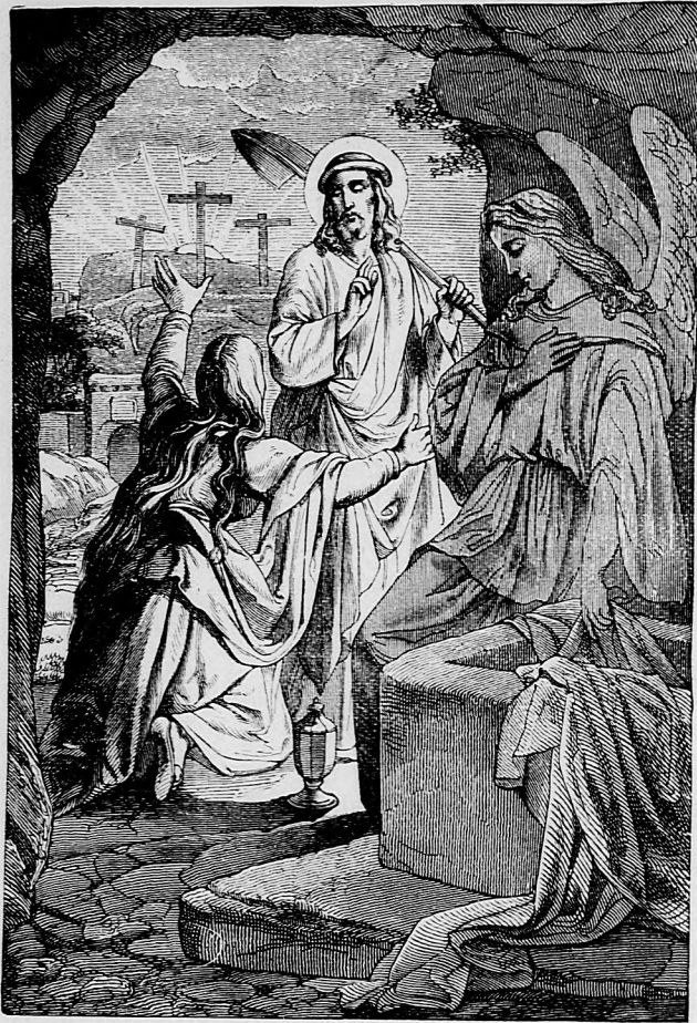
Niet ho tu! ... Vstal z mrtvých! ...

vajú noviny. S týmto s jednej strany poľahšia našu prácu, nadovšetko ale koniec môžeme urobiť takým nepravostiam jako je to, že noviny v svojom čase nedochádzajú.