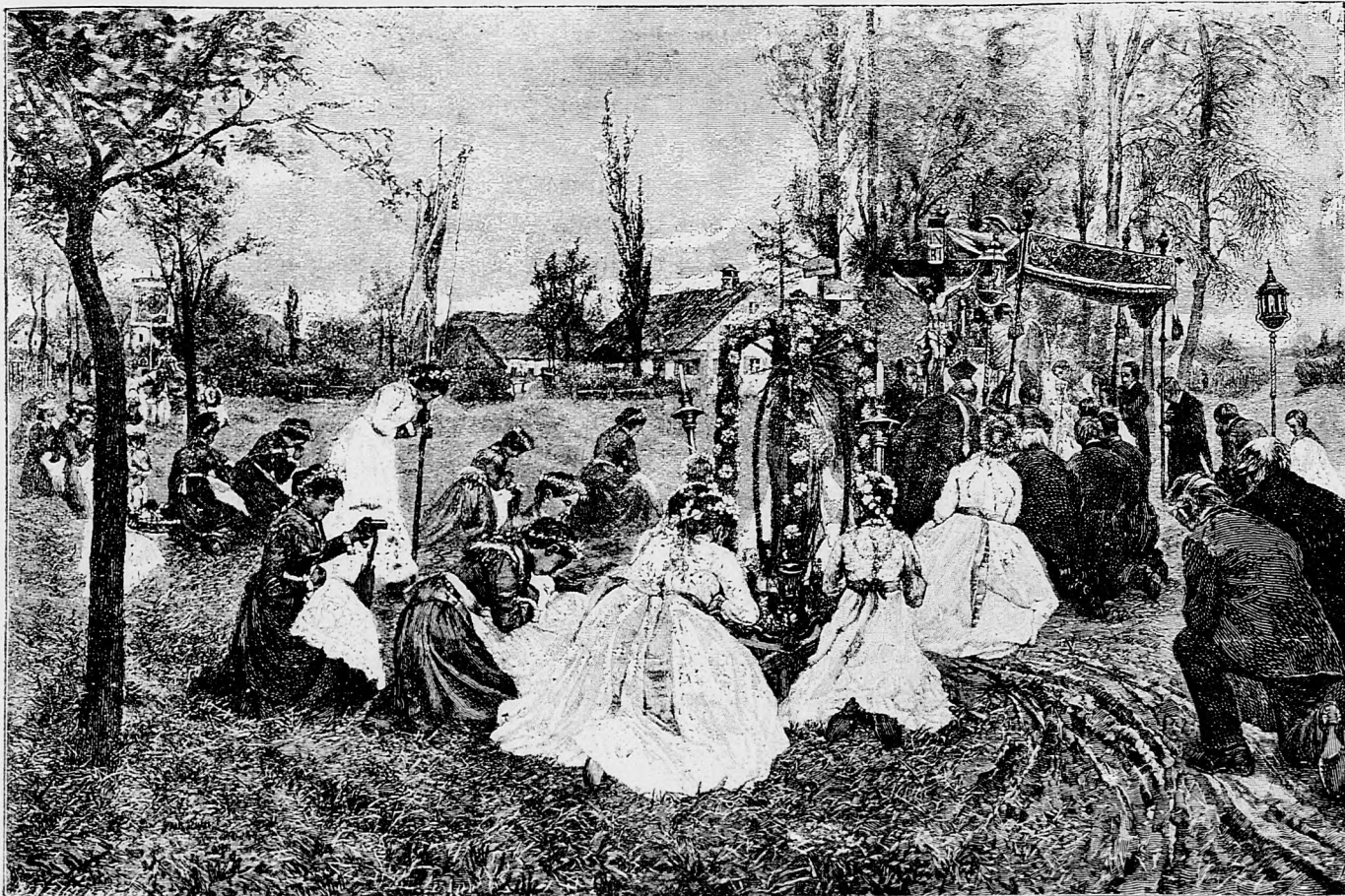
Pán Kristus vstal z mrtvých! Alleluja! ...

čierneho chleba, ktorý potutvárne vyhľadáva. Už viac nesnese. Synov, ktorých chcú odobrať za vojakov, súrne potrebuje pri práci, aby porcie vládali platíť. Peniaze, ktoré k povýšeniu vojenských tiarch pýtajú, potrebuje na výživu. Takto žaluje sa národ. Takto opisuje biedu svoju. Ruky spína, slzy roní a bolastne volá: «Majte milosrdenstvo nado mnou! Nesužujte ma s väčšími farchami! Nepýtajte viac vojska, veď ho máme na zbyť. Veď nestačíme platíť naň. Ono prehltnie všetko, čo by sme obrátiť mali na vývin hospo-