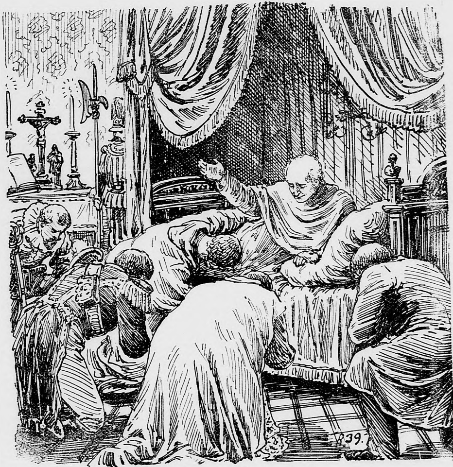
Požehnanie zomierajúceho pápeža.

Toto je prvé zakročenie vlády oproti opilstvu. Síce, minister rozkaz tento len prevzal od hevešskej stolice, ktorá ho ešte roku 1893. vydala a vyhlásila v obciach svojich; a tak povedať môžeme, že liberálna vláda až do dnešku ľahostajnou zostala oproti najväčšiemu nešťastiu národa. Síce, ani teraz nechce zakročiť určite, lebo sa len vyzvedá, v ktorej stolici dal by sa previesť