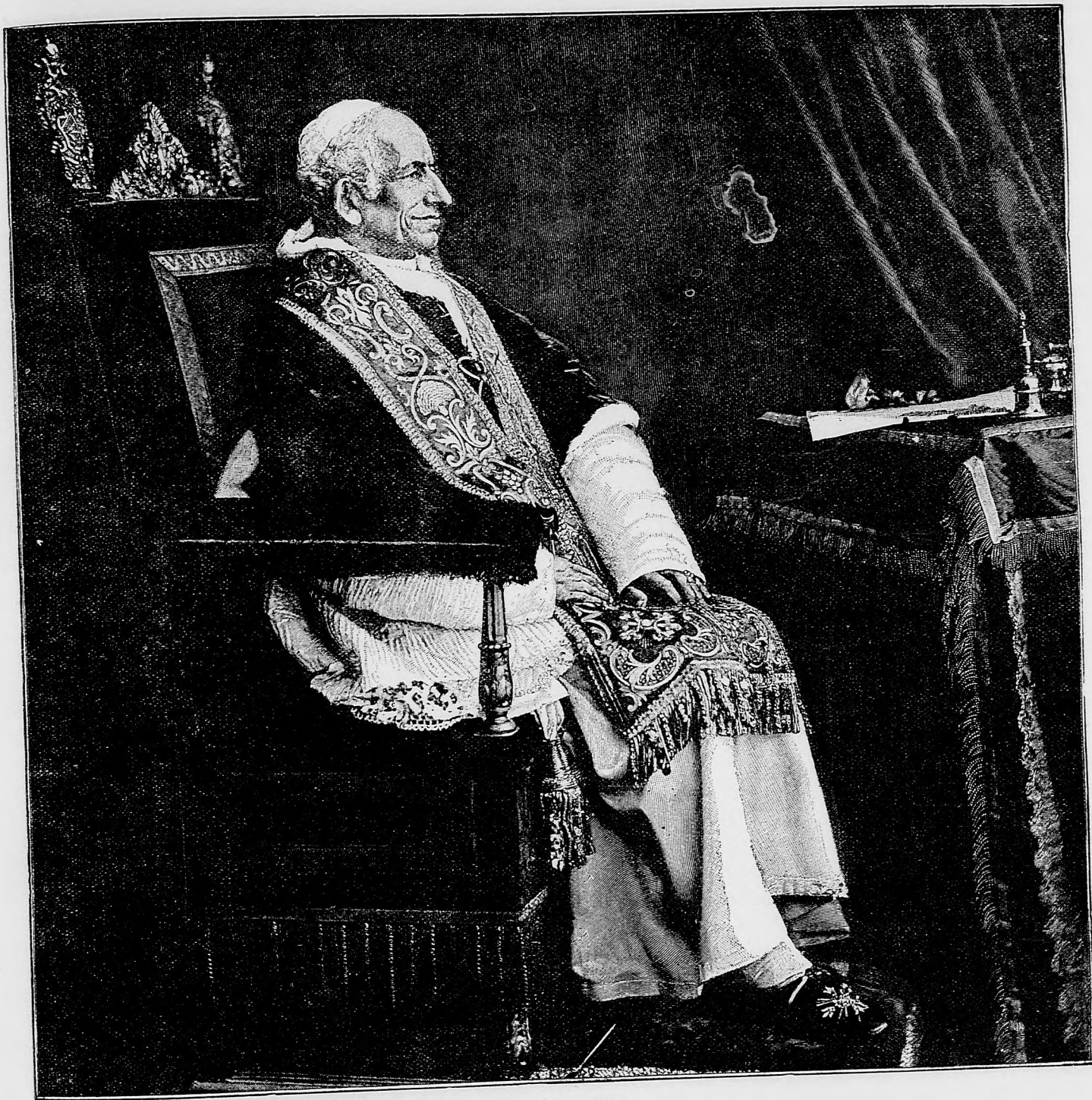
Pápež Lev XIII.

— Nuž veď to je kňazožrút a nepriateľ kláštorov, a a to jeden z tých najbesnejších.