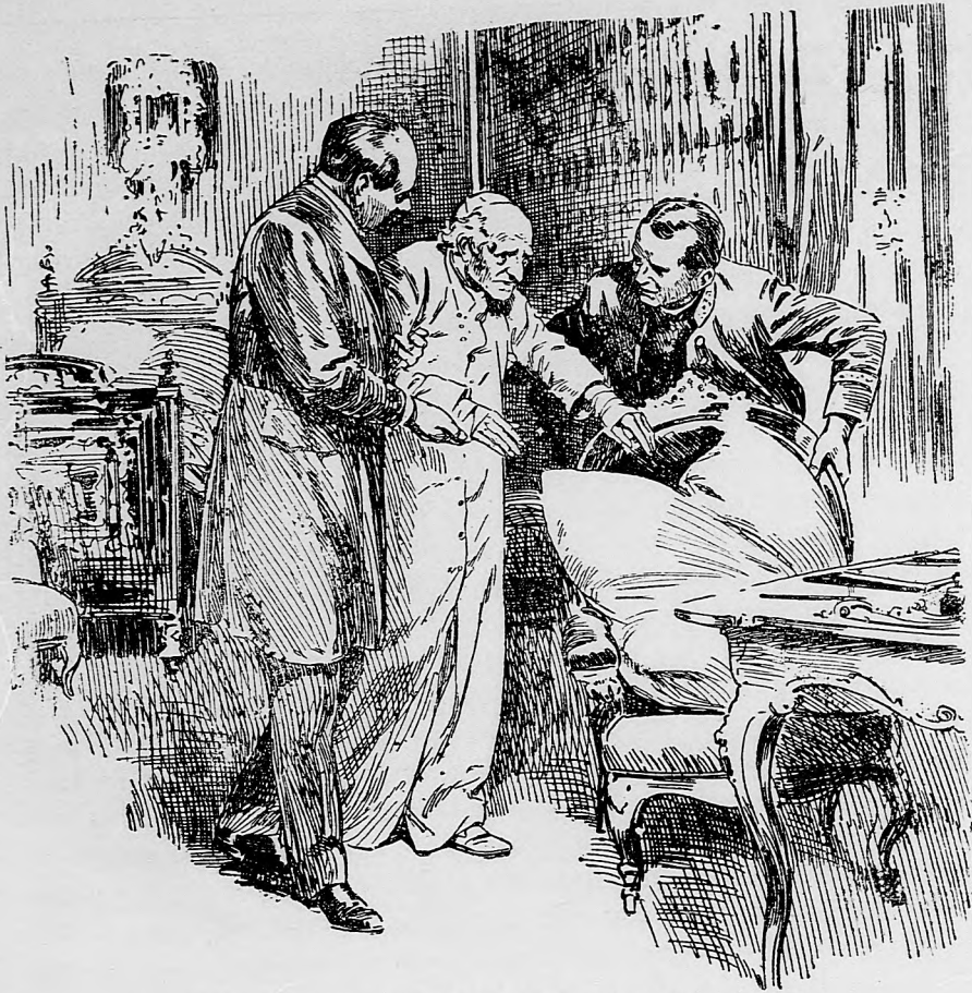
Pápeža do operadlovej stolicy uvádzajú jeho lekári.

húceho, stvoriteľa nebe i zeme», to nemá toľko kolomutiek a háčkov, ako tie vysoké vody, a nemusíš sa toľko pajediť nad vysokou múdrosťou, čo ani nerozumieš, ako tí kapitulníci sa tej muzike nerozmeli.