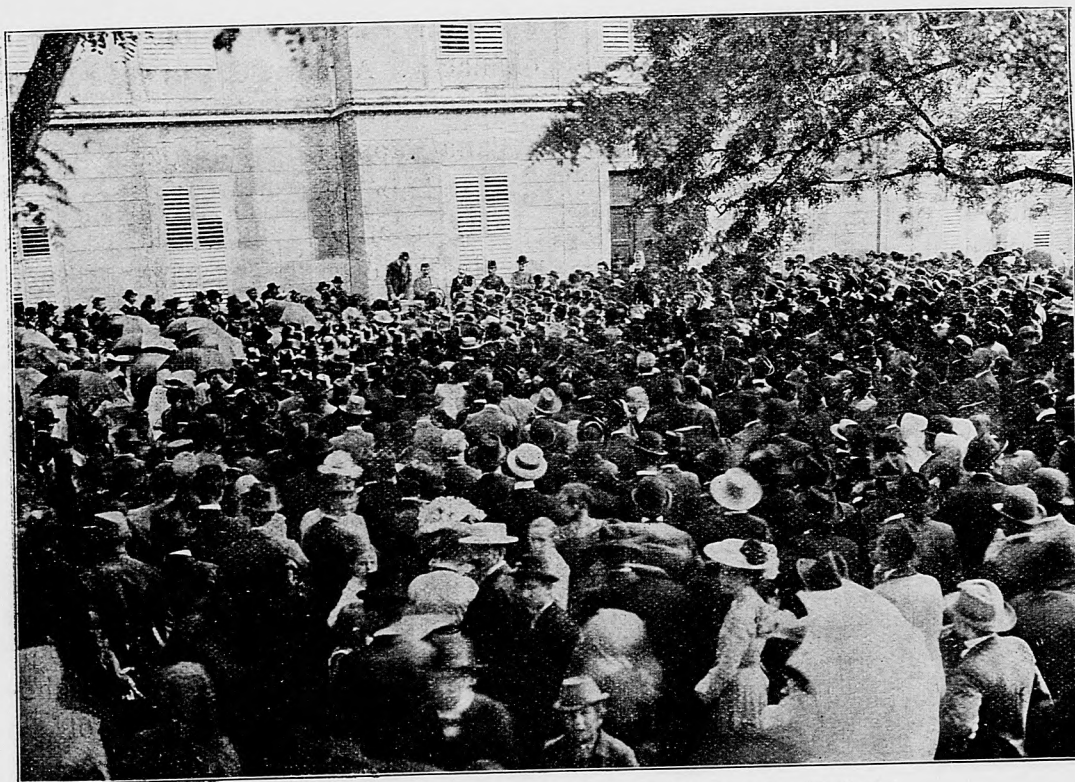
Zariadujúce shromáždenie kresťanských delníkov v Szombathelyi.