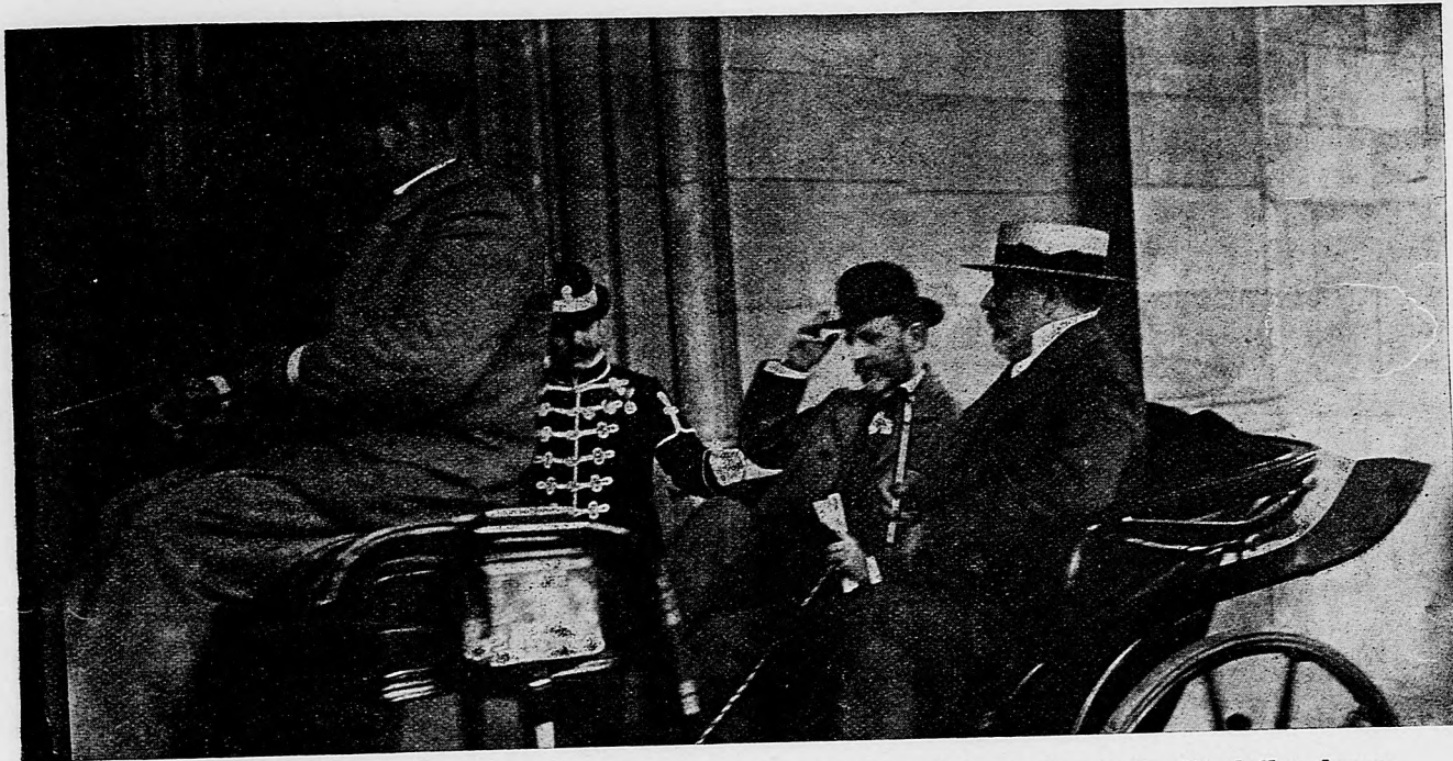
Príchod minist. predsedu gr. Khuen-Héderváryho v deň zadakovania do krajinského domu.

Upozornenie. Viac ráz obrátili sa už ku nám jednotlivci s tým, zdáľž je spoľahlivý ten alebo onen ústav