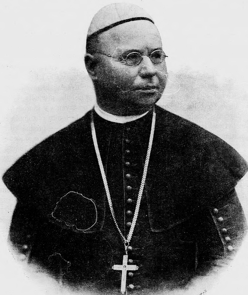
Sámuel Hetyey, biskup, narodil sa r. 1845 13. sept., zomrel 1. sept. 1903.

Budapest, VIII. ker., József-körut 35. sem sa majú posielat' predplatky, jako dopisy do novin ohlášky a náhodné reklamácie. Cena jedneho 5 stĺpcového malého riadku je 20 hl. Rukopisy sa naspak nedávajú.