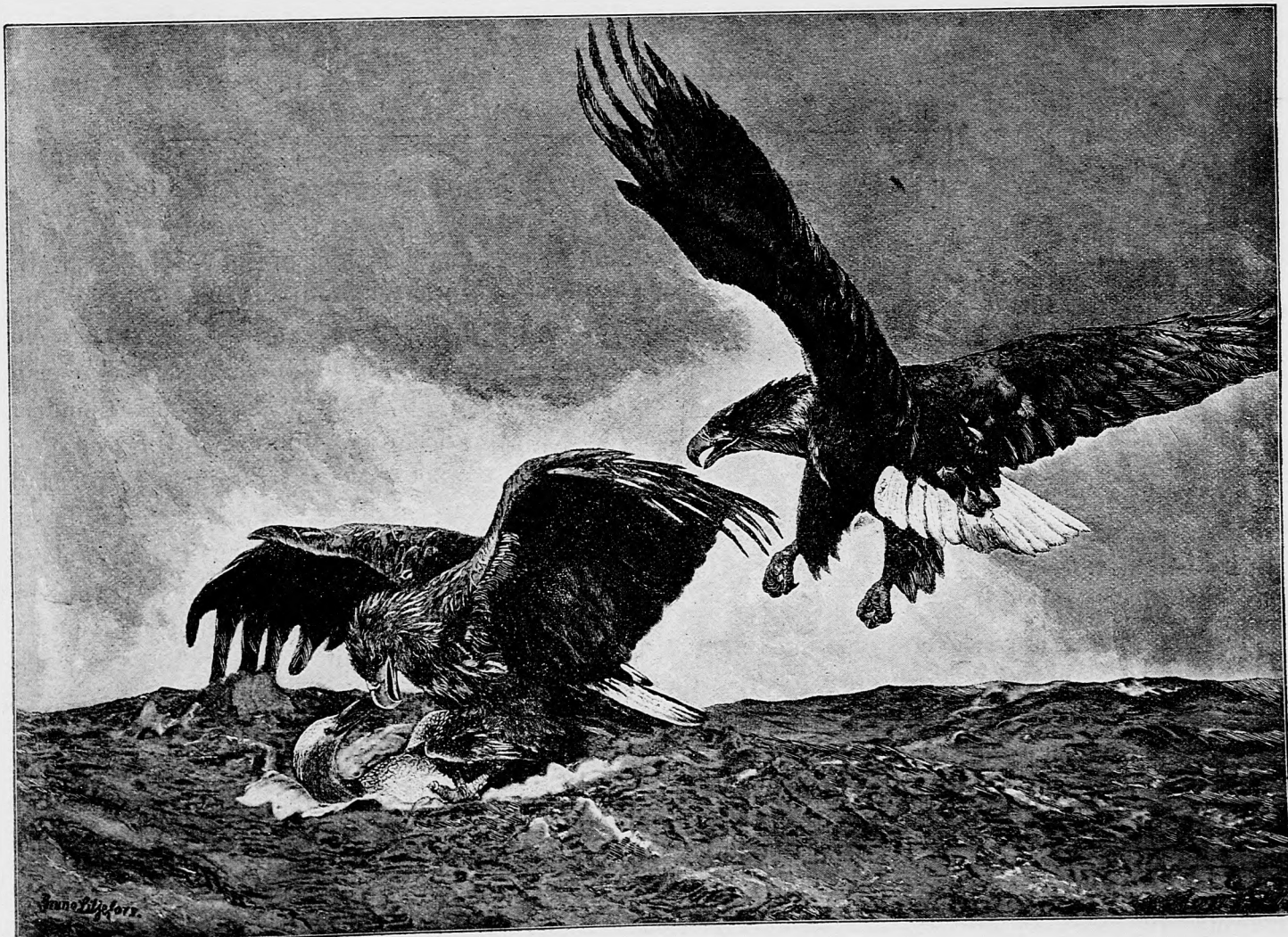
Boj na mori.

súdobníctve. — S druhej strany zas dalo sa dost určite badať, že Jeho Veličenstvo, ako najvyšší vladár vojska, ryzhodne protiví sa akejkoľvek zmene, ktorá by bola vstave narušiť jednotu nášho spoločného vojska. Výsledok ale týchto protiv bol stav ex-lexu a to, že bývalá vláda Széllova musela zažakovať, a musela zažakovať aj nová vláda pod ministerpredsedníctvom gr. Khuen-Héderváryho. Kráľ, prepustiť aj túto vládu, nevyme-