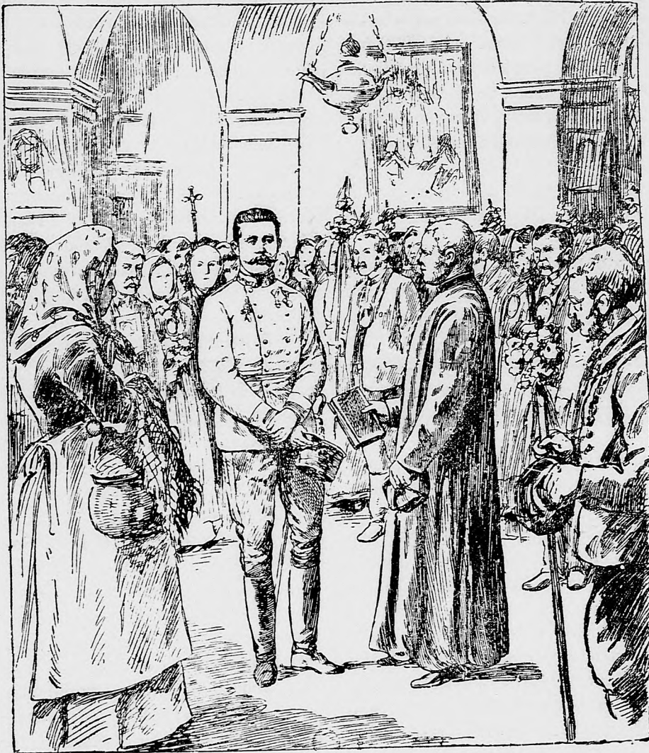
Putujúci nástupca trónu.