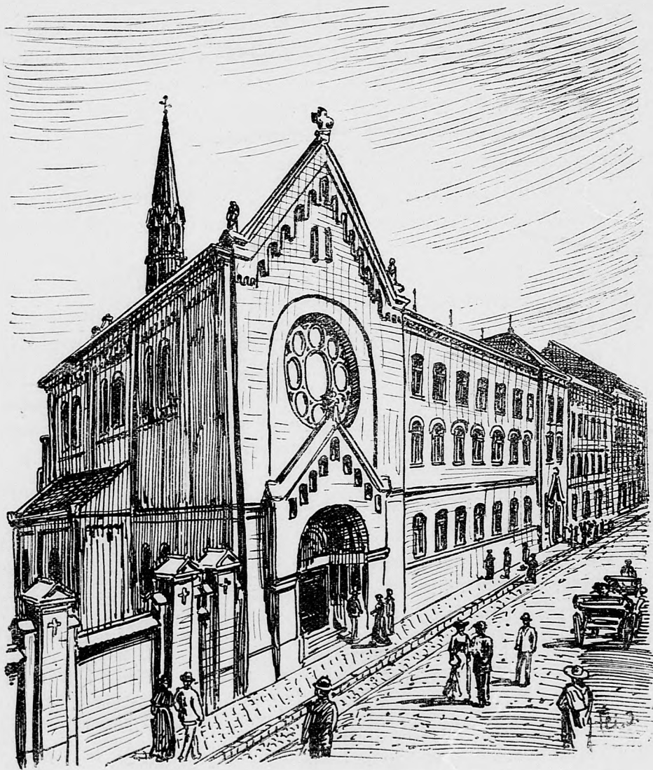
Nový kostol lazaristov v Pešťbudine.

ako praví občania krajinskí, cit lásky a hlbokkej poklony chovaly a chovajú ku nemu. Nevernosť, zrada, búrenie a protivenstvo ani sa nesrovnáva s ľudáctvom. Dobrý ľudák je v každom ohlade príkladným občanom krajinským. Však sám Ježiš naskladal, aby sme takíto boli, a preto len ten môže byť dobrým vlastencom kto nasleduje prikázanie Kristovo a plní všetky té povinnosti, kto-