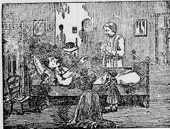
«Mne už nič nepomôže, — riekol — nechajte ma pokojne umreť!»

A ja som si teda dal doniesť od lekárnik Feller 2 tucty Elsa-Fluidu za 8 korún 60 halierov a 6 balíkov Elsa-piluliek na prehnanie za 4 koruny a s čistým vedomím môže každý povedať že Fellerov «Elsa-Fluid» je najlepší prostriedok. Kto je chorý predovšetkým nech oprobuje a objedná si ho od lekárnik EUGENA V. FELLERA, Stubica, Templom-utca 18. (záhrebská stolica). Každý mi bude povďačný za dobrú radu.