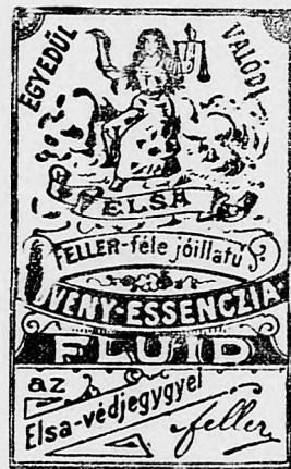
Chráňte sa od napodobňovateľov