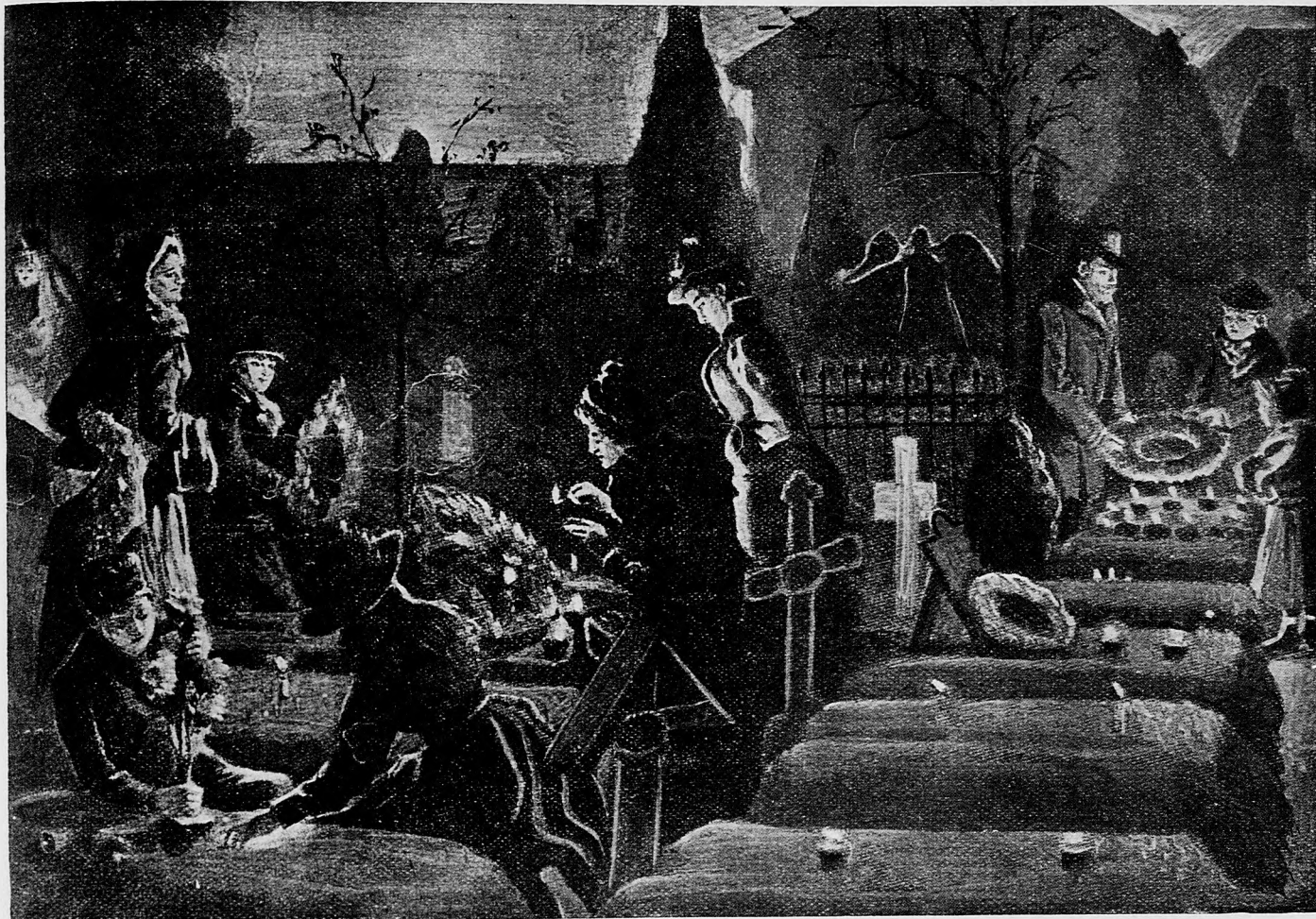
Večer všetkých verných dušičiek.

Kráľovná mlečiarkou. Hollandská kráľovná Vilhelmina má na jednom zo svojich korunných statkov veľký dvor, v ktorom vo veľkej miere pestuje mlečiarsťvo. «Kráľovské mlieko», «kráľovské maslo» a «kráľovský syr» sú u Hollandčanov tak obľúbenými, že doptávke