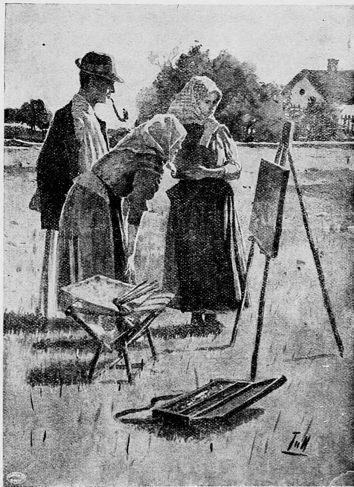
Maliar na dedine.