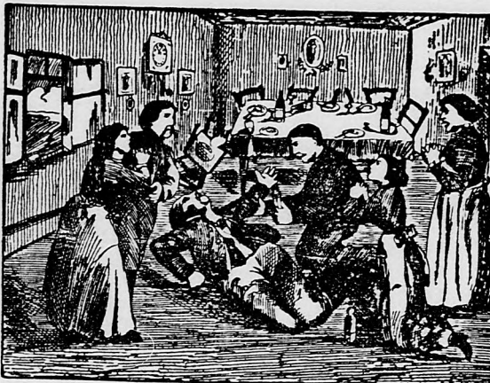
Môj dobrý priateľ hneď otvoril oči a šeptal: «Ešte, ešte!»