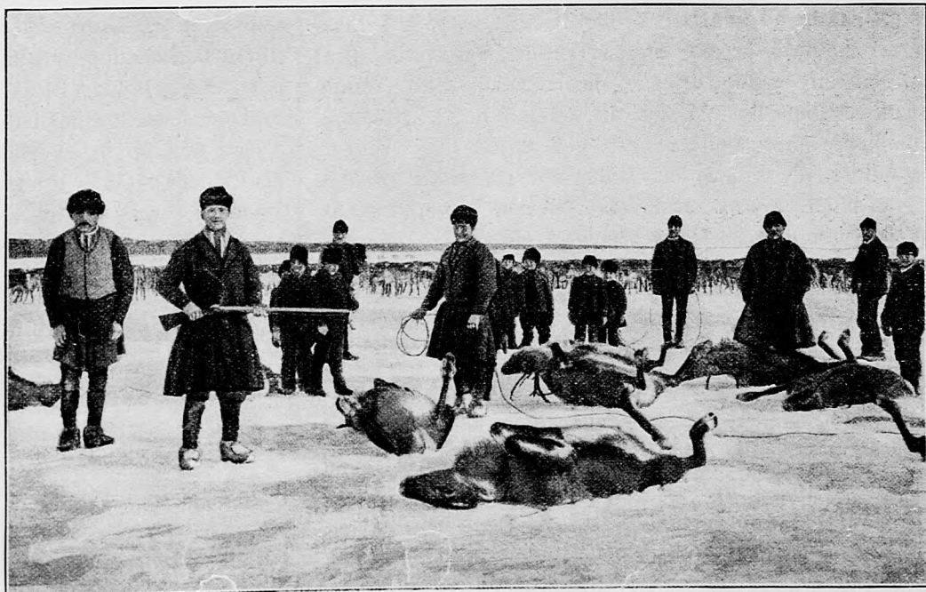
Lovenie sibirských jeleňov.