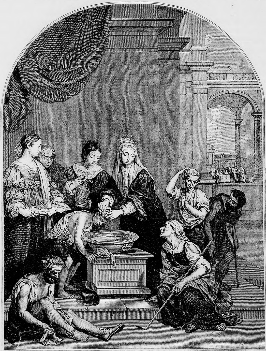
Svätá Alžbeta uhorská medzi chudobou.

Tisza nepotreboval k zariadeniu vlády veľkej starosti. Veď všeliaké hodnosti a záujmy spriatelia i nepriateľov osobných. Tisza, keď videl že staroliberali sa ho pridržiajú, a že mladoliberali sa