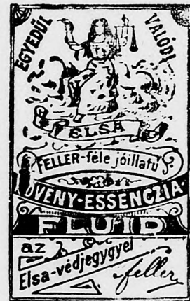
Chráňte sa od napodobňovateľov.