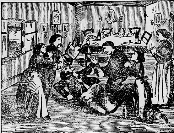
«Mne už nič nepomôže, — riekol — nechajte ma pokojne umrieť.»

«Hľa» — riekol mi priateľ Karol — «takto zachránil sen život jednej celej rodine.» Keď sa po dedine roznesol chýr o podivuhodnej liečivej sile Fellerovho Elsa-Fluidu , všetci chorí objednali si z tohoto výtečného domáceho prostriedku a všetci presvedčili sa, že pravý Fellerov Elsa-Fluid úplne a rýchlo lieči rheumu, opuchlé nohy, obličkovú nemoc, opuchliny, pichanie zimnicu, pakošnicu, chromé ruky a nohy, klepanie, srdca, vzdychavosť, hučanie v ušach, bolenie zubov a zlý zápach úst, zvlášte ale slabosť očí a nervové choroby, nemoce hrtana a hrdla, škrofle, rany, zmrzle údy, ružu, plusgiery a bradovce . Ľudia dali užívať Fellerov Elsa-Fluid aj deťom proti zlatke, horúčke, osýpkam, zachrypntiu, kašfu , proti hlístam, natreli deťom telo Fellerovým Elsa-Fluidom , keď mali výsyp na tvári, alebo na tele, ba, keď mali na hlave homporu a Fellerov Elsa-Fluid vždy osožil. Aj takí ľudia, ktorí ešte so