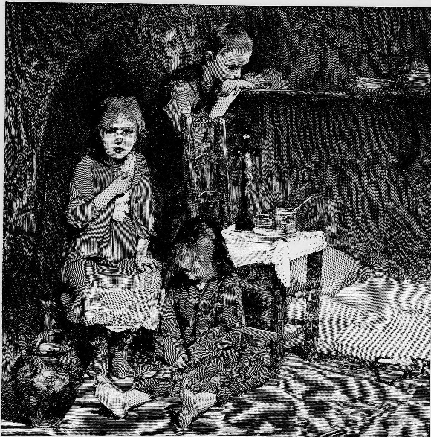
Osamotené plačúce siroty.

svoj život ešte nebol nemocný a aj teraz len pre jakúsi nepatrnú nehodu sa dostal do nemocnice. Ako hovorí, ešte by desať-pätnásť rokov ľúbil pracovať a zatiaľ by si prispobil toľko groší, že by sa mohol na pokoj utiahnuť. Lekári, ktorí starca preskúmali, nádej jeho nedržia za nemožnú, ponevác starc je taký zdravý ako buk.