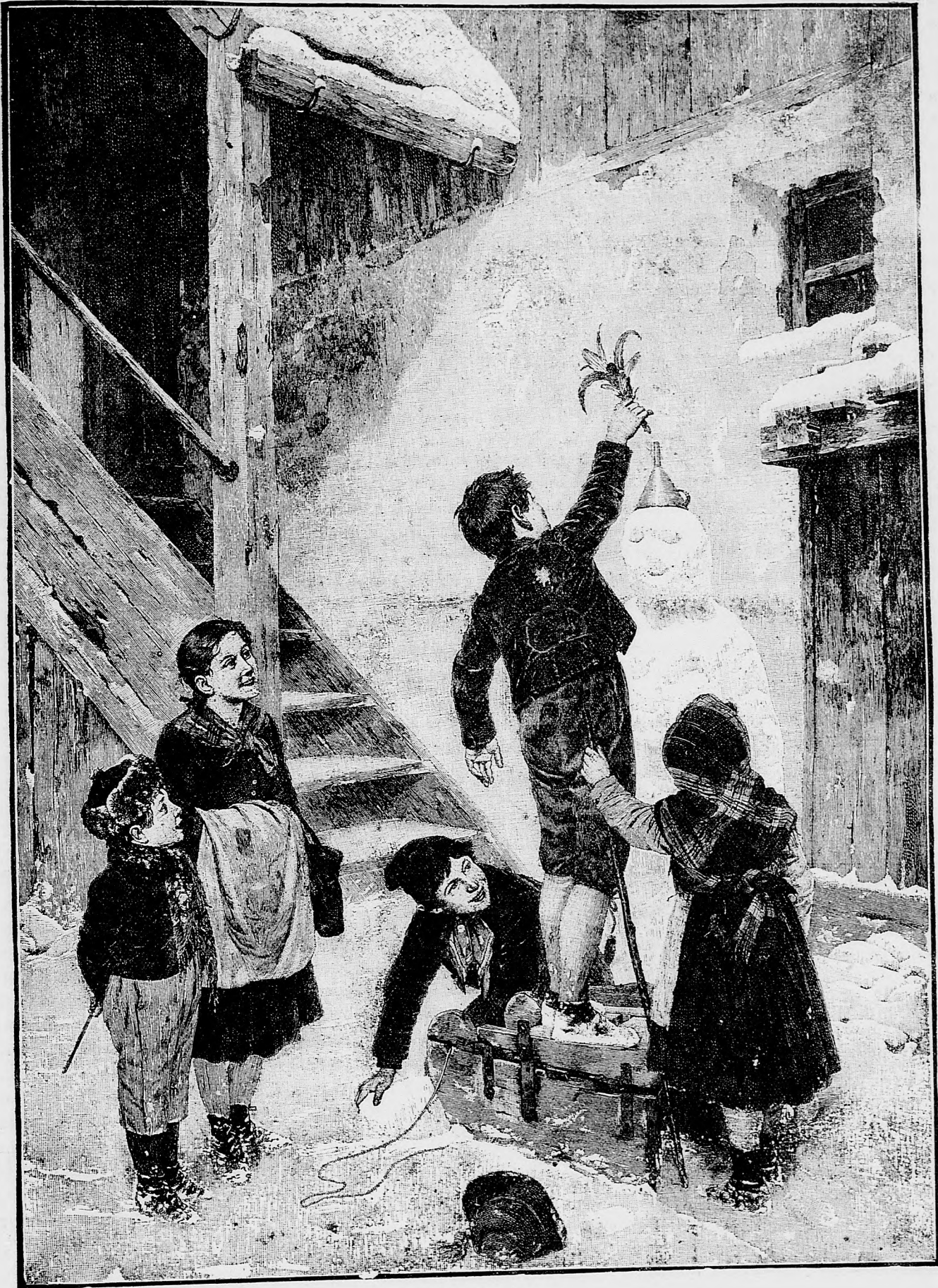
Radost v zime.