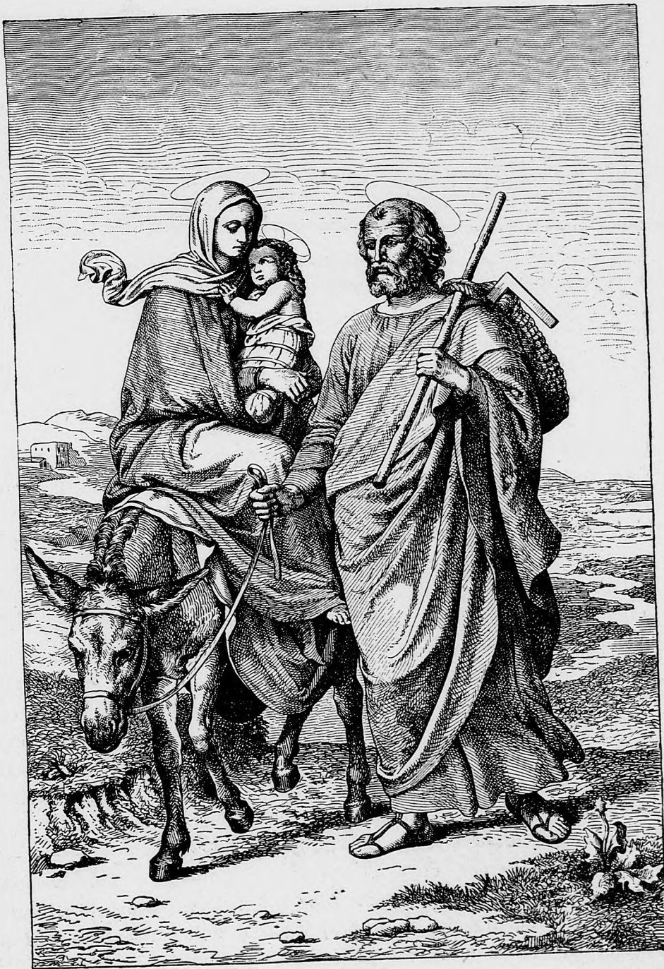
Útek do Egypta.

Na pr. dáky dobrosrdečný katolík založí kláštor, zaraz narobia blaku v novinách svojich, že hrnú sa k nám mnišky a reholníci z Francie; že aké nebezpečenstvo hrozí reč a cudzie obyčaje. — Nech sa ukážu volakde missionári, zaraz hromžia oproti buričom, ktorí ohlupujú svet, a búria oproti iným vierovyznaniam. Áno, toto zbadajú, ale o tom čušia, že koľko zbojníckych kazárov dochádza k nám cez hranice, ako zdieľajú, klamu