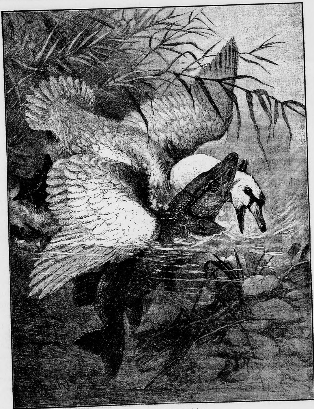
Boj medzi labufou a štukou.

To rozumiem, že židáci, kalvíni a frajmaureri dali sa do