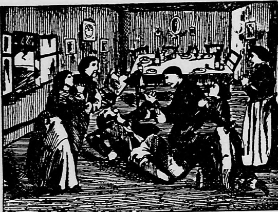
Môj dobrý priateľ hneď otvoril oči a šeptal: «Ešte, ešte!»