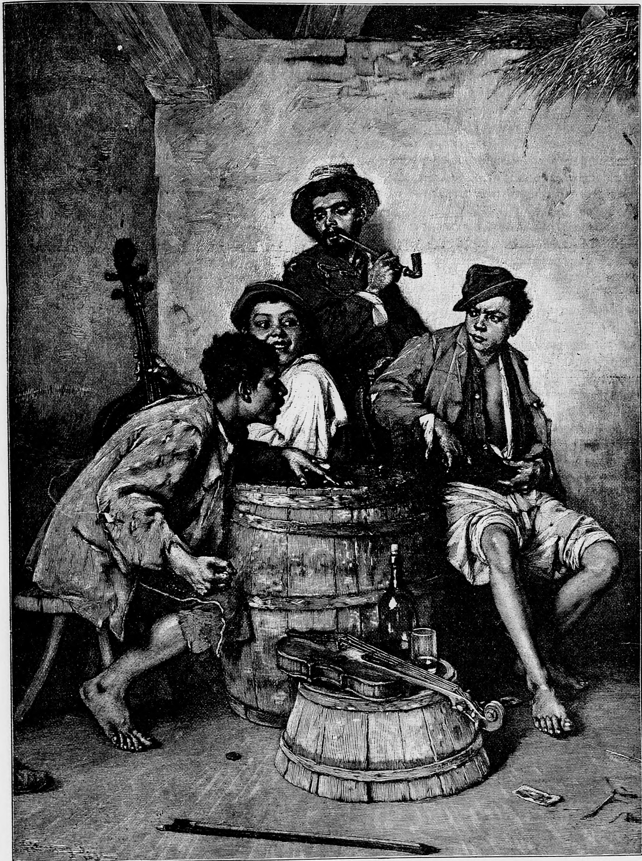
V pokojných hodinách.