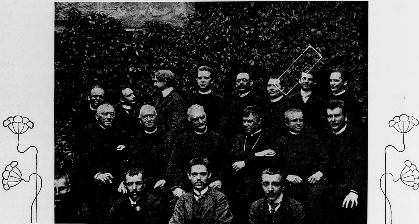
Čiast uhorských hostov na kat. sjazde v Regensburgu.

Taktiež výborne zorganizovaní sú aj nemeckí ľudáci.