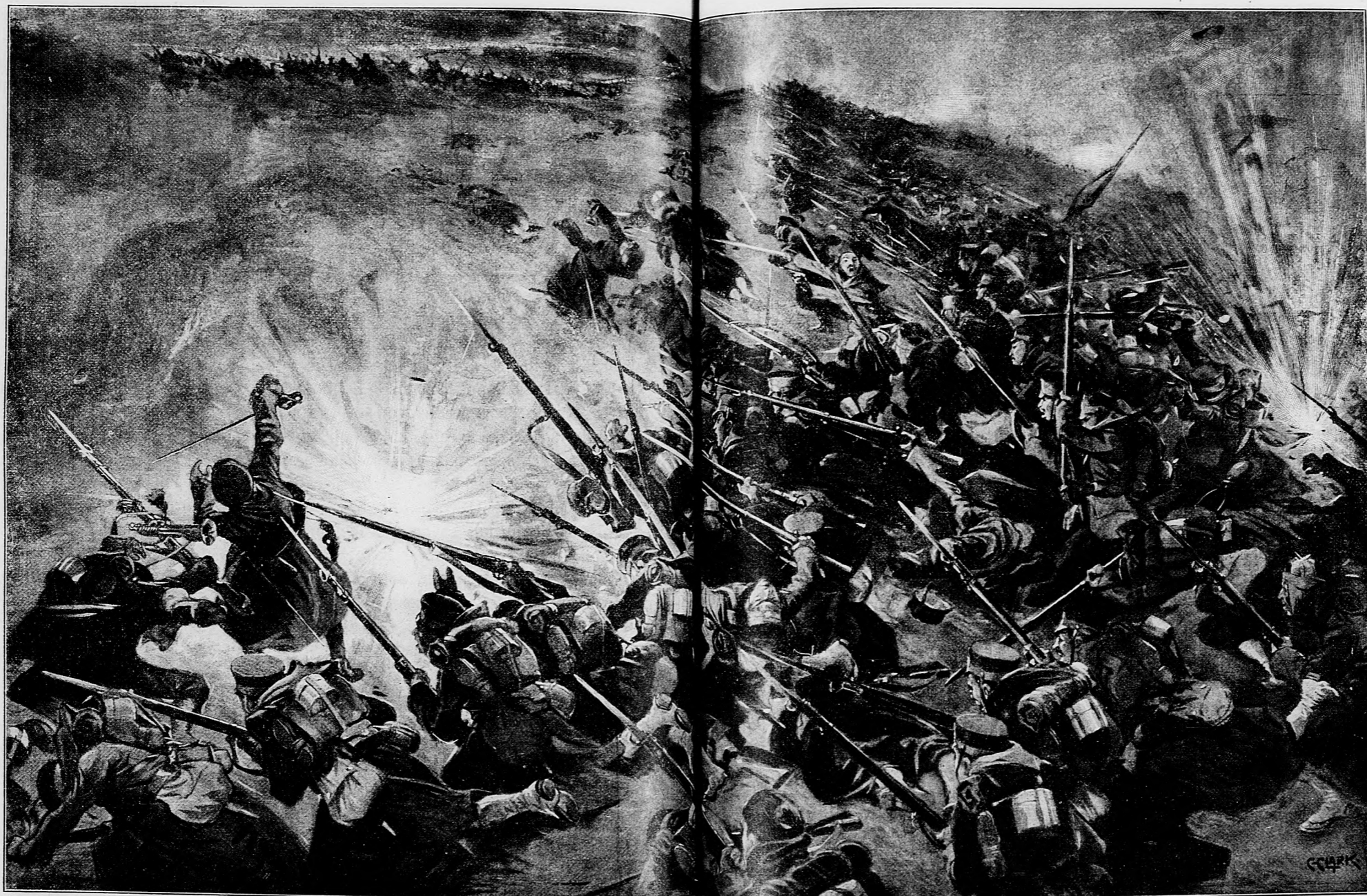
Hodenie bomby od Rusov medzi dobýjaním japonské vojsko na vrchu Sansan.

Zhorelo 14 ľudí. Kedykoľvek príde chýr z Ameriky o nejakom nešťastí, vždy sa dočítame, že prišlo v ňom o