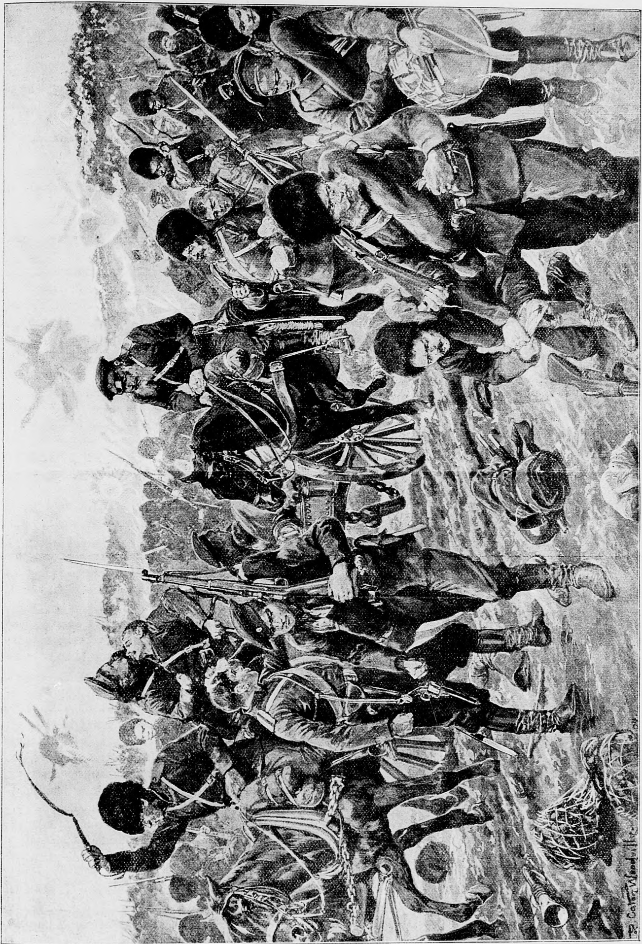
Ut'ahovanie sa Rusov ku Mukdentu.