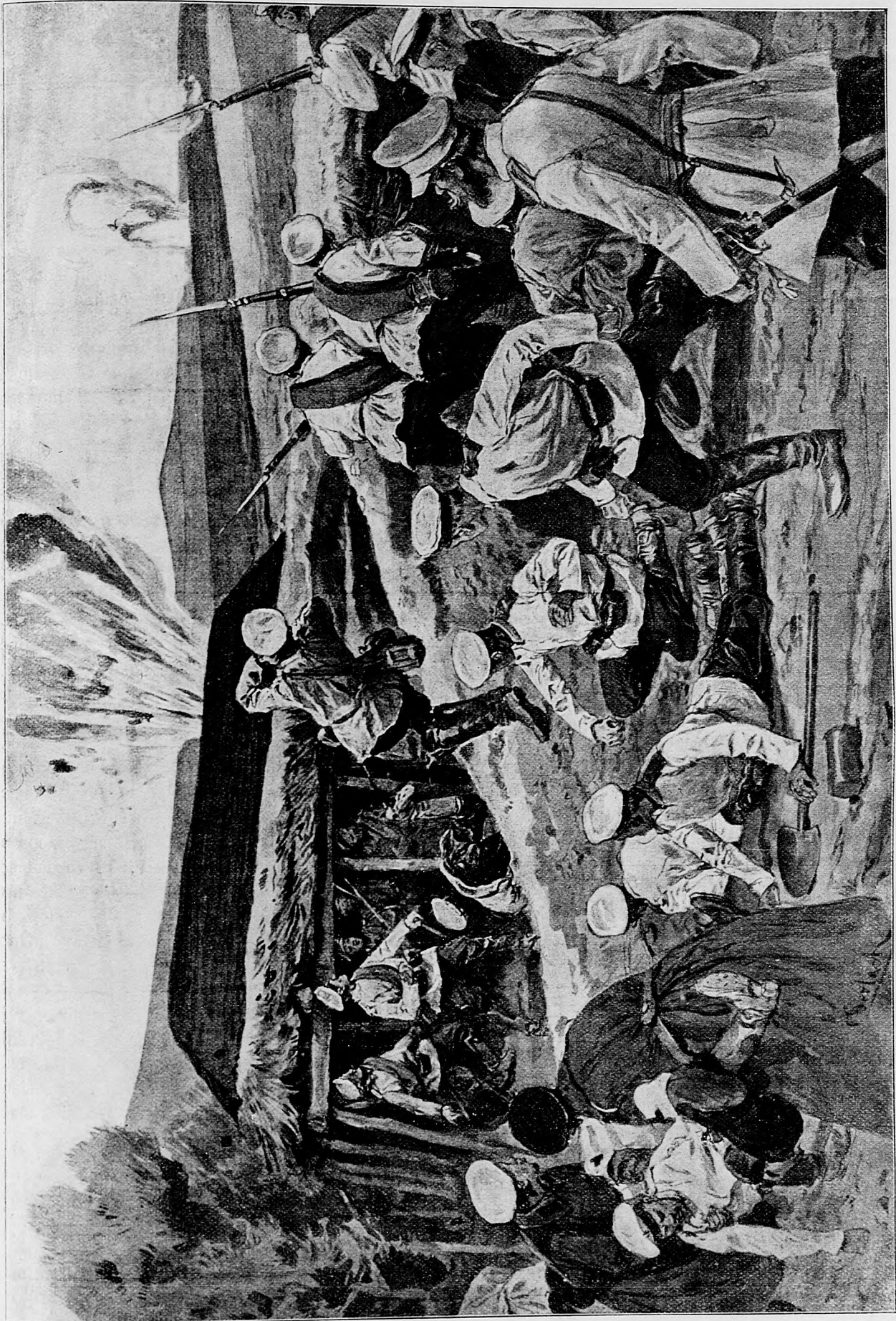
Japonci bombardujú ruské leženia.