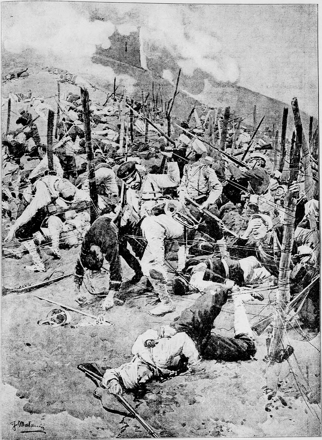
Nápad na drôtové opevnenia v Port-Arture.