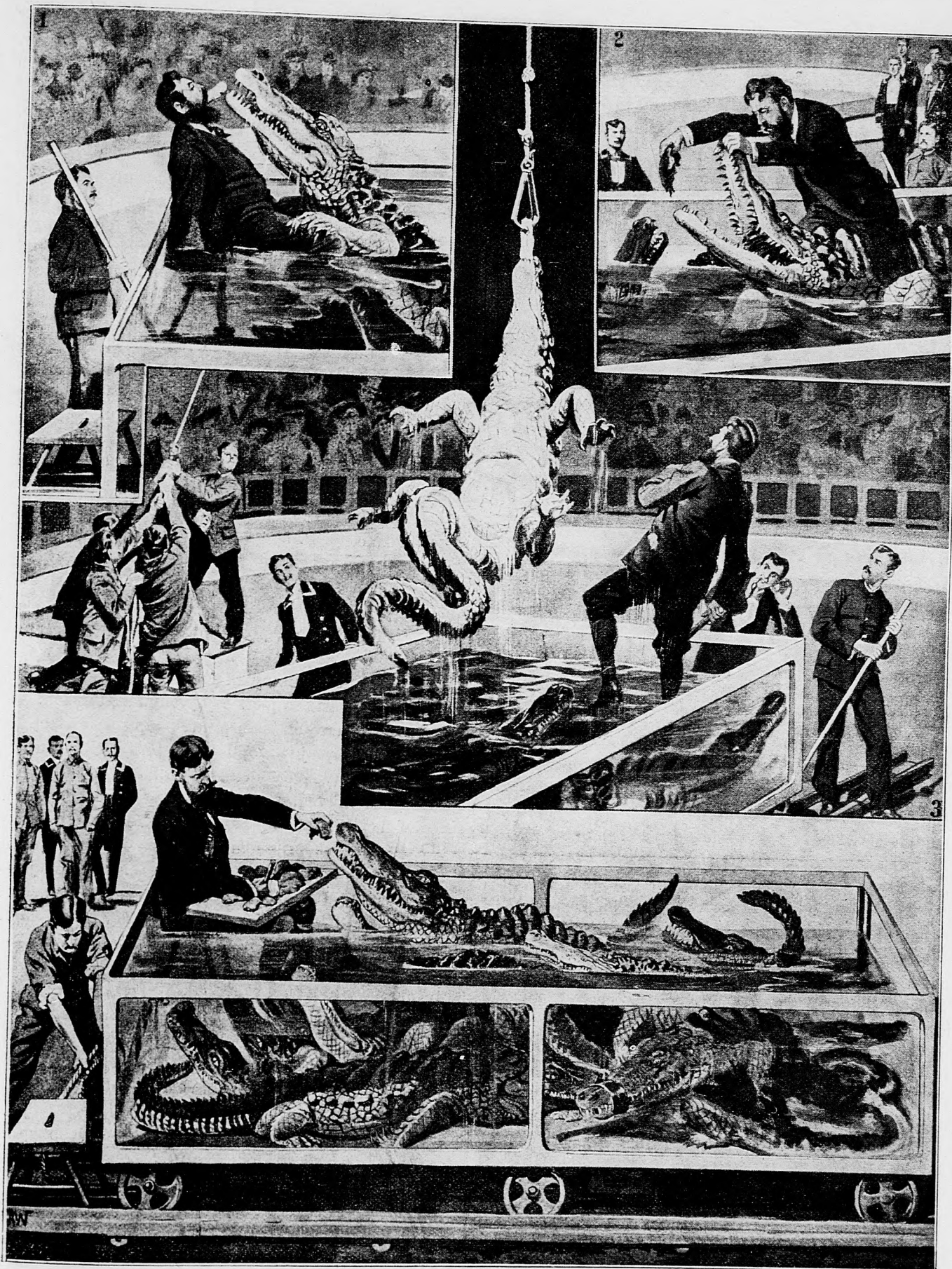
Skrotené krokodile v Berline.