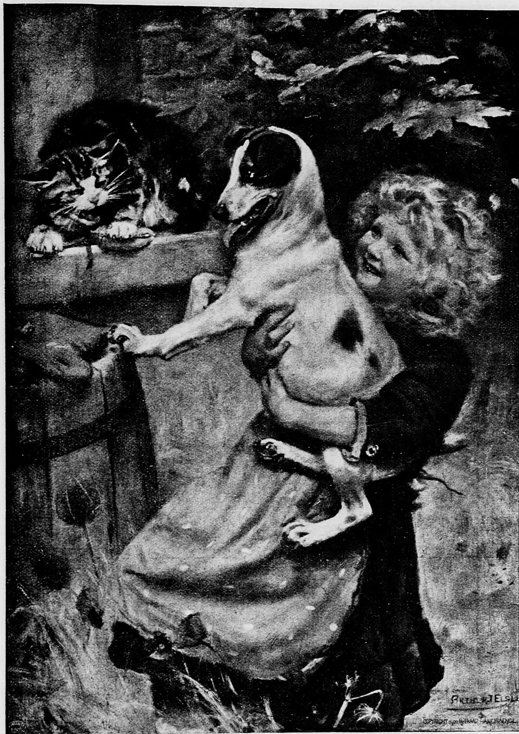
Priateľ'stvo mačky so psom.

fony Panny Marie po popoludňajších službách Božích predpísané. Cieľu primerane a úhľadne vystavené toto tlačivko zasluhuje čo najširšieho rozšírenia po našich slovenských farnostiach. Strán má 8, formát taký, že sa