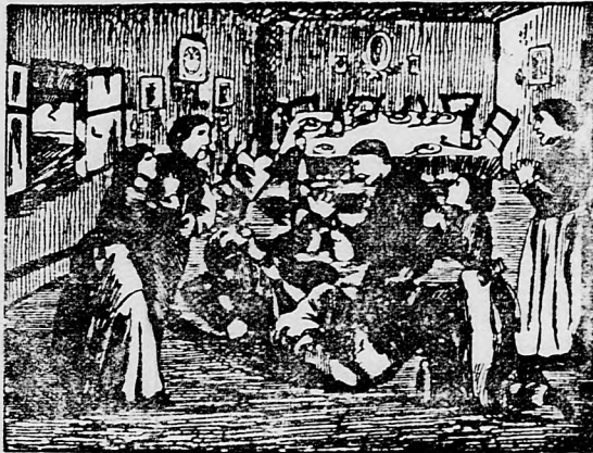
Mój dobrý priateľ hned otvoril oči a seplal: «Ešte, ešte!»

klanie, tak, že ho z vojančiny domov poslali, ale doma mu tiež nebolo lepšie, vždy viac a viac chradnul, mal koliku, bolenie prs, užil všelijaké lieky, ba i všelijakých fluidov, o ktorých čítal v kalendároch, ale nič mu nepomohlo. Tu čítal raz v kalendári rozprávku lo Fellerovom Elsa-Fluidu a o Elsa-pilulkách a hned si objednal u lekárnik E. V. Feller v Stubici, Templom-utca 18. (Záhrebská stolica) 1 tucet (12 flašiek) Elsa-Fluidu za 5 korún a 6 škatuliek Elsa-Piluliek na prehnanie za 4 kor. Poštovné porto zaplatil dobrý apatekár sám. Užil denne trikrát po 20 kvapkách Elsa-Fluidu v šálke sladkého mlieka a tre si denne 2 krát čistým Elsa-Fluidom žalúdok, brucho, prse a všade tam, kde bolel cítil; z Elsa-Piluliek užil denne 4 a bolo mu so dňa na deň lepšie a teraz je úplne zdravý a každému odporúča proti všetkým neduhomprávy Fellerov Elsa-Fluid a Fellerove Elsa-pilulky. Teraz všetia ľudia v dedine užívajú Fellerov Elsa-Fluid a liečia ním menovite popáleniny, rany, klanie, štiepanie v údoch, zrádnik, hlisty u detí, slabý zrak. Jeden človek bol už takmer slepý, a za 6 týždňov upotrebil Fellerov Elsa-Fluid roztriedený s vodou k umývaniu a teraz zase vidí ako predtým, keď bol ešte mladý.