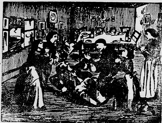
«Mne už nič nepomôže, — rieknuť — nechajte ma pokojne umrieť.»