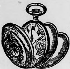
Len 4 zl.