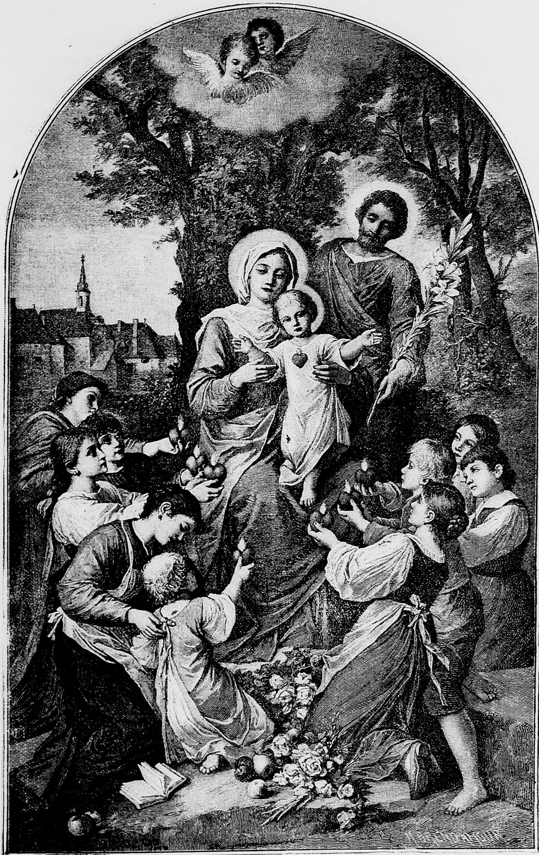
Dietky, podte ku mne!

ešte aj u takých chorých ťažké nemoce istotne vylieči, ktorí od 10—15 rokov trpeli a ktorí marne hľadali kde-