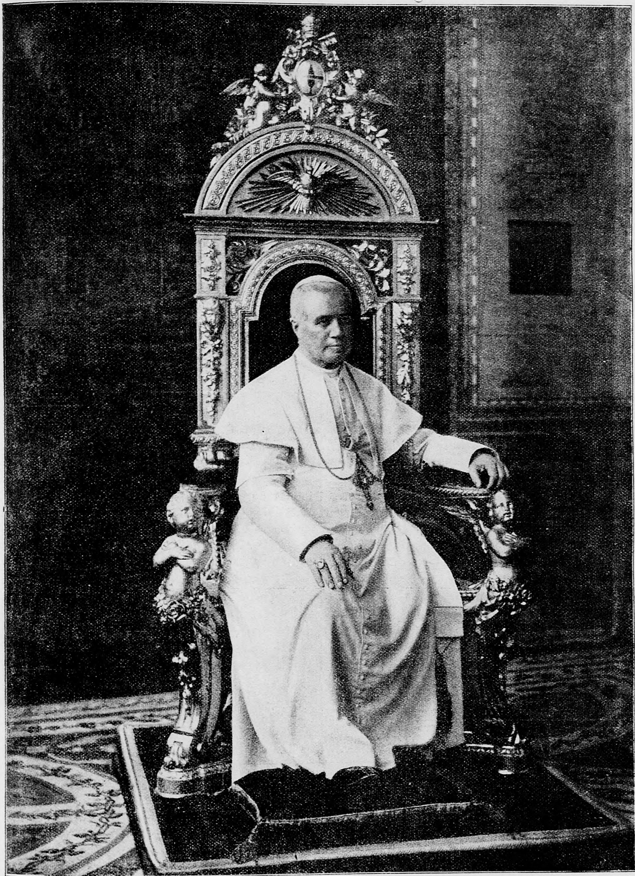
Najvernejšia podobizňa jeho svätosti pápeža.