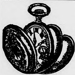
Len 4 zl.

Sukne Lodenové, polovlnené, rôznych a stálych barev, 1 kus po 65—70 kr., sukne „Mandžuria“ (novinka!) po 1 zl. 20. 1 zl. 25 kr. vyrábí a dobierkou zasiela: Adolf Jelinek v Lisku, p. p. Jimramov, Morava. Nehodíci se zboží buď vymením, aneb vezmu zpět a peníze vrátím; nespokojenosť vyloučena! — Do 5 Kg. balíka se vejde 7 sukni! Vzorky zdarma franco!