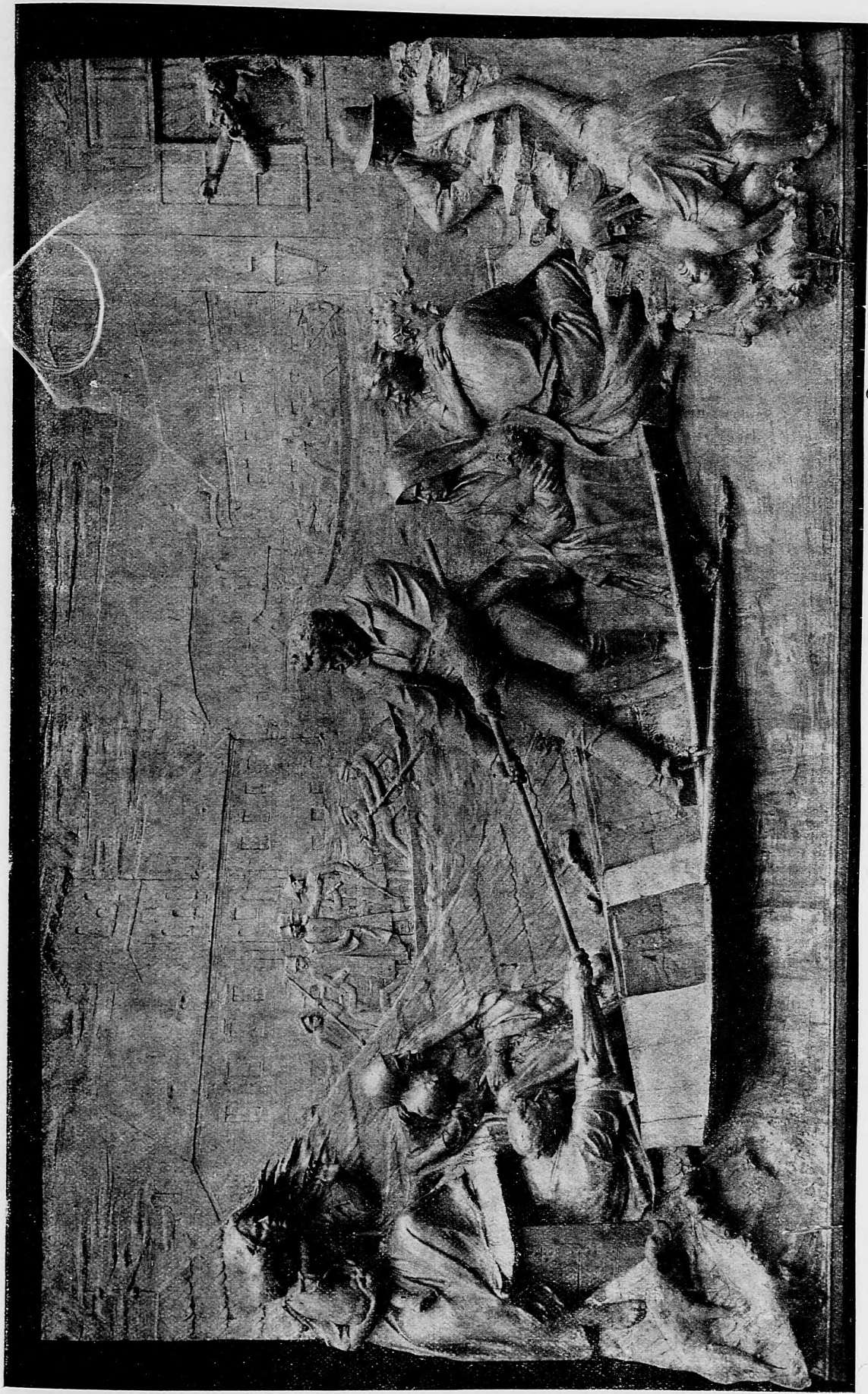
Mikuláš Wesselényi pri peštanskej povodni 1838 ratuje topiacich sa.