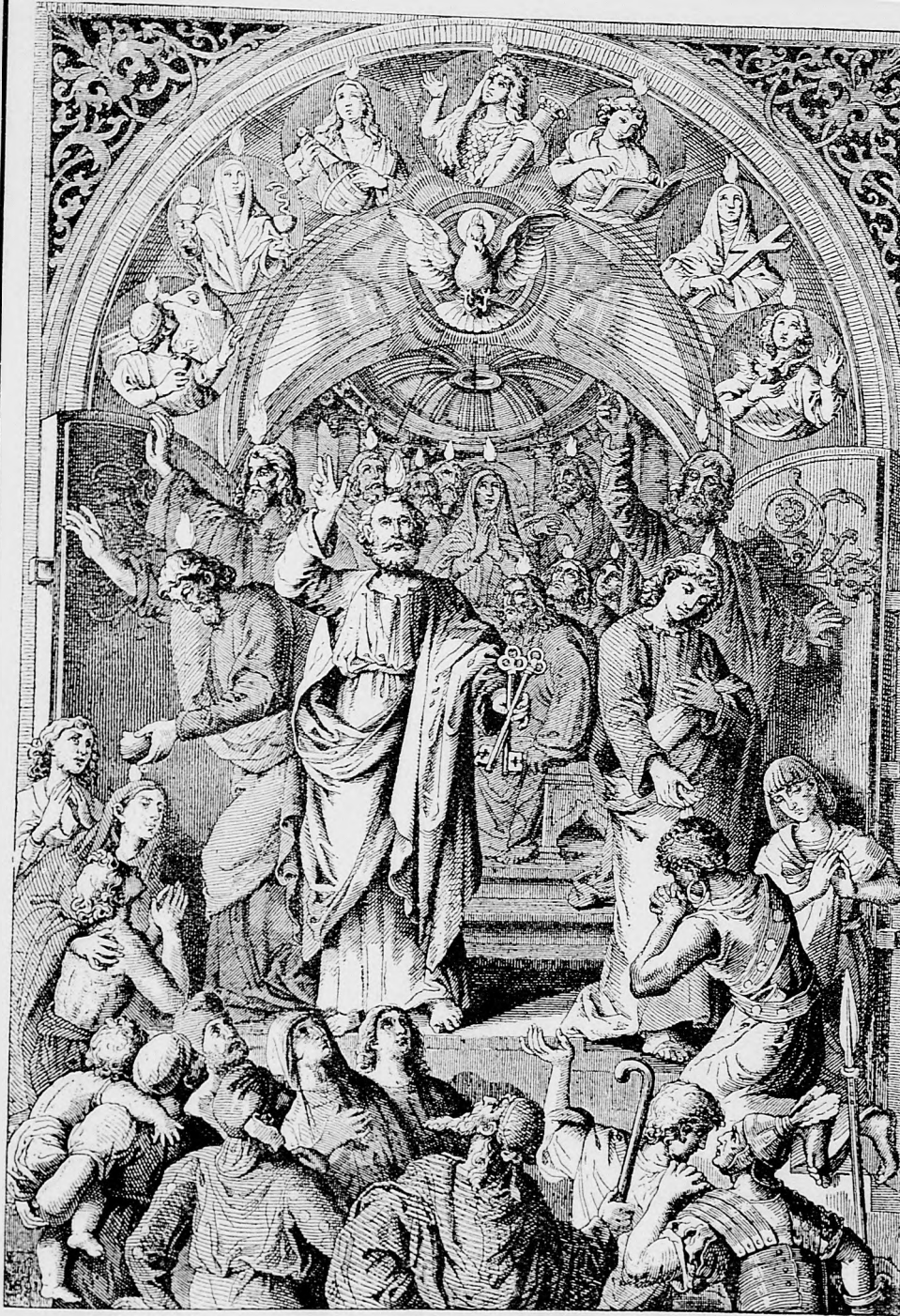
Zoslanie Ducha svätého.

Budapest, IV. ker., Ferencz-József-rakpart 27. szám. sem sa majú posielat' predplatky, jako dopisy do novin ohlásky a náhodné reklamácie. Cena jedneho 5 stúpcového nonpareill riadku 30 hl. Rukopisy sa naspak nedávajú.