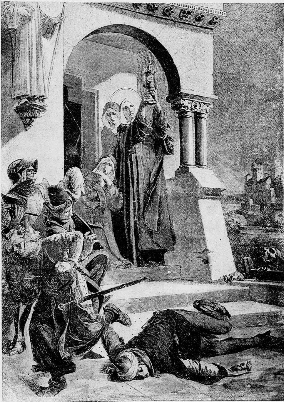
Moc prevelebnej sviatosti oltárnej.

Budapest, IV. ker., Ferencz-József-rakpart 27. szám. sem sa majú posielat' predplatky, jako dopisy do novin ohlásky a náhodné reklamácie. Cena jedného 5 stĺpcového nonpareill riadku 30 hl. Rukopisy sa naspak nedávajú.