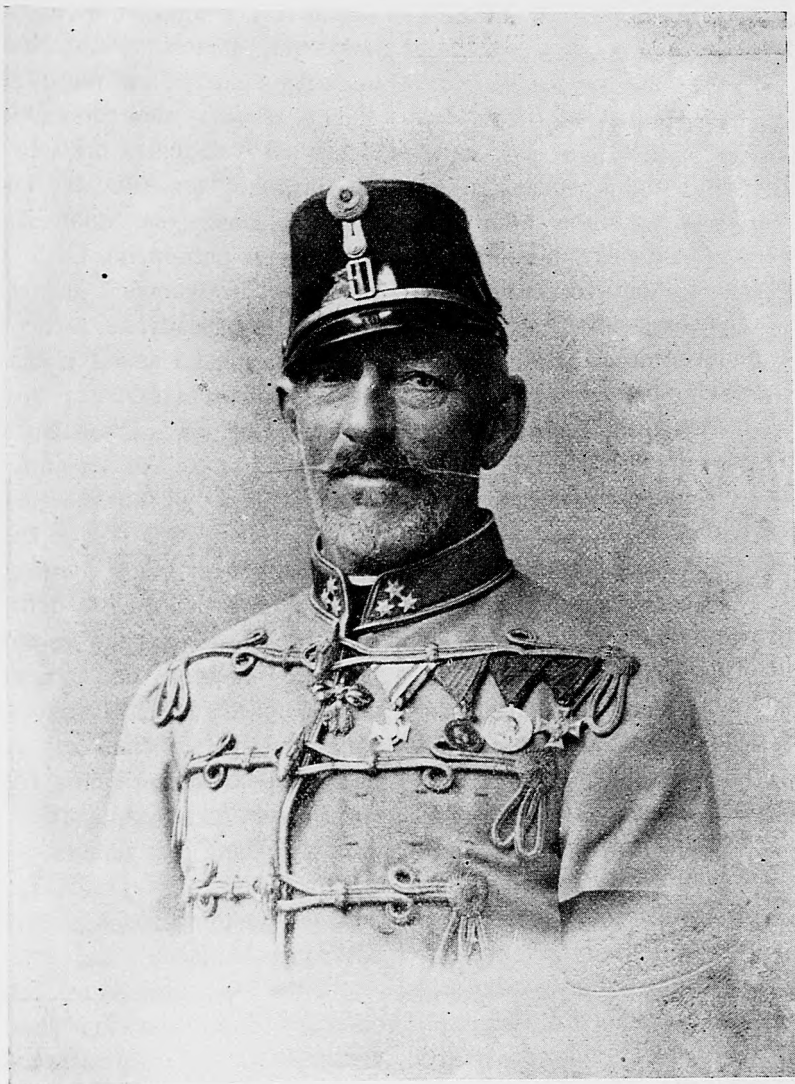
Arciknieža Jozef †.

istých dedinách a miestach. Ku tomuto cieľu vo svojich panstvách dal im potrebné kúsky pozemkov a dával im stavať domky. Aby ich ale ku domácnosti privrátil to sám obcoval s nimi a k vôli nim osvojil si celkom reč cigáňsku. Toto ale nebola len taká veľkopánska passia, lež mu ozaj ľúto bolo, že ten kmen ľudstva ako zo spoločnosti ľudskej vysotený bez útulku o hlade ako aj smáde vandruje z miesta na miesto, a preto ho učil a vzdelával, čo sa mu ale pravda celkom nepošfastilo. I druhú, za terajších časov už veľmi známu ustanovizeň zriadil u nás v krajine, a tak rečeno povzbudil ku životu, a toto je ustanovizeň hasičov. Ku hasičstvu položil on prvé základy v krajine. Bol on aj vždy veľkým ochrancom