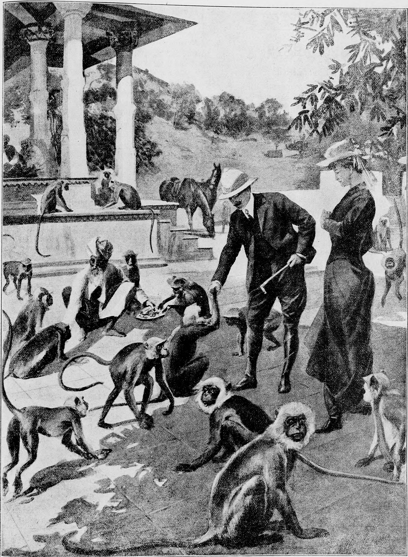
Krmenie krotkých opic.