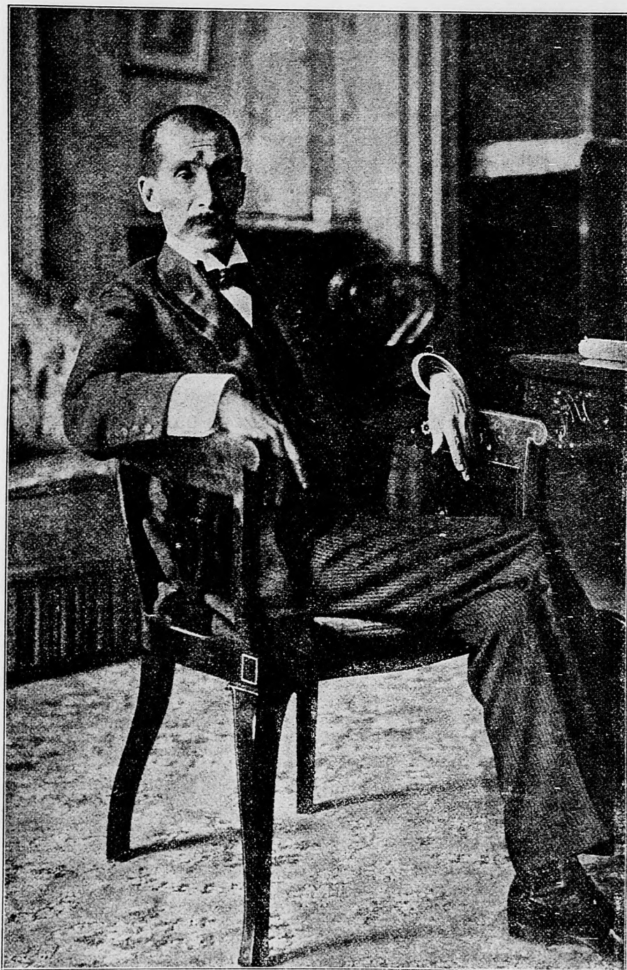
Komura, japonský vyslanec pri uzavretí pokoja.

V tých hrozných zápasoch, ktoré besne proti koalícii vedú, prišli liberáli s jejich neblahými žartami ku koncu. A preto vyhodili teraz jejich ostatný tromf. Ako sa namáhali rozdvojiť koaliciu! Všetky jejich snahy byly ale daromné. Dali sa očerňovať, pomlúvať jednotlivých údov koalície. Očerňovali ich v Budapešti, očerňovali ich vo Viedni, ba ešte až tam kdesi v Berlíne spojili sa so židmi, dali písať tie najsprostejšie a najhnusnejšie veci, platili hrozné peniaze, len aby jednotlivé osobnosti koalície nemožnými učiniť mohli. Všetko na darmo. Ohavné plány liberálov vyšly na svetlo a záležitosť táto ku väčšej oslave li-