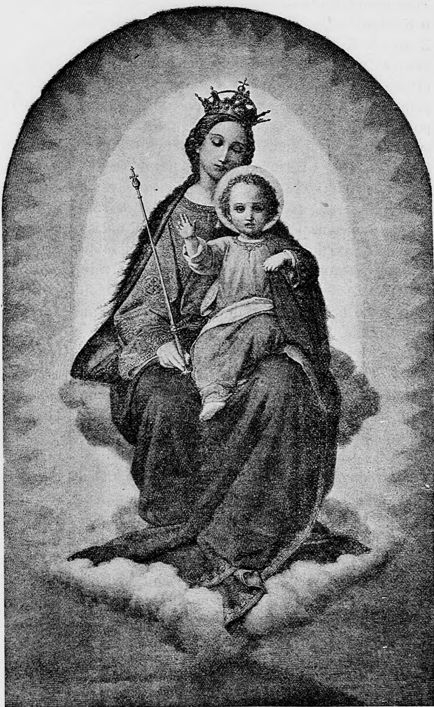
Patrónka Uhorska, oroduj za nás !

Kristóffy zas bráni sa a jeho volebné právo svojim spôsobom. Opakuje najprv jeho chýrnu reč, ktorú mu druhý spravil, a ktorú sa on ako sojka naspamäť naučil a zle-nedobre povedal, keď ako kandidát v Bogšani vystúpil. Túto chýrnu reč porovnal potom s Tiszovými článkami a potom povedal s veľkým seba-povedomím : hľa toto sú prvé následky slobodného volebného práva. Čo toto majú byť za následky? Rozdvojenie politických stránok. Toto chce a chce Kristóffy s jeho všeobecným a súkromným volebným právom docieľiť. Ostatne, kto zná Kristóffého a jeho zámery, musí byť presvedčený o tom, že kým jeho návrh k prevedeniu príde, z toho vo-