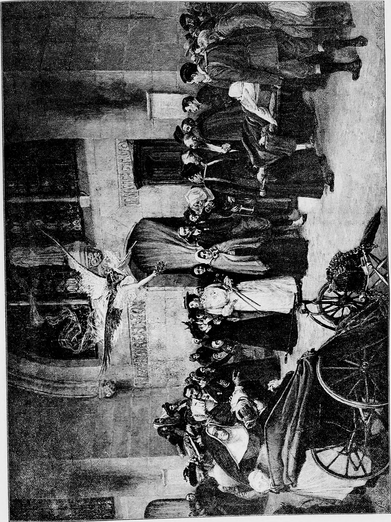
Jedno zázračné vyliečenie v Lurde.