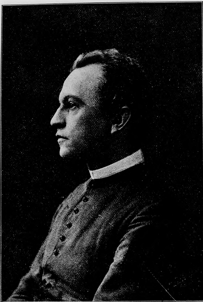
Dr. Ottokár Prohászka, nový biskup stolno-belohradský.

týždňov chodil jeden šedý medveď ktorý narobil ľuďom veľa škody. Tak minulé dni neďaleko obce Junet-de-Suchon napadnul jednu ovčiu čriedu, viac oviec roztrhal a pri tom niekoľkých gázdov-ranil. Na to jeden mladík odhodlal sa, že medveďa vyženie z jeho úkrytu. Sledujúc krvavé stopy vošiel do hory. Keď obišiel jeden ker, od rázu stál pred medveďom. V nasledovnom okamihu medveď vrhol sa na mladíka a ho strážne dodriapal. Z tváre vykúsol mu jeden kôdný kus mäsa, jedno oko mu vykriabalo dlapou a pravú ruku mu zlomil. Na šťastie boľastné kričanie napadnutého mládenca počul jeden na