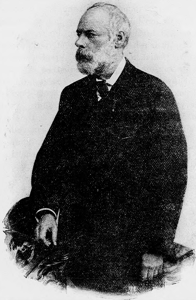
Gróf Ferdinand Zichy, tavernikus a zakladateľ ľudovej strany.

K lepšiemu porozumeniu okolností aké panovaly pod liberalizmom, obraciame pozornosť kresťanského ľudu na ten smutný