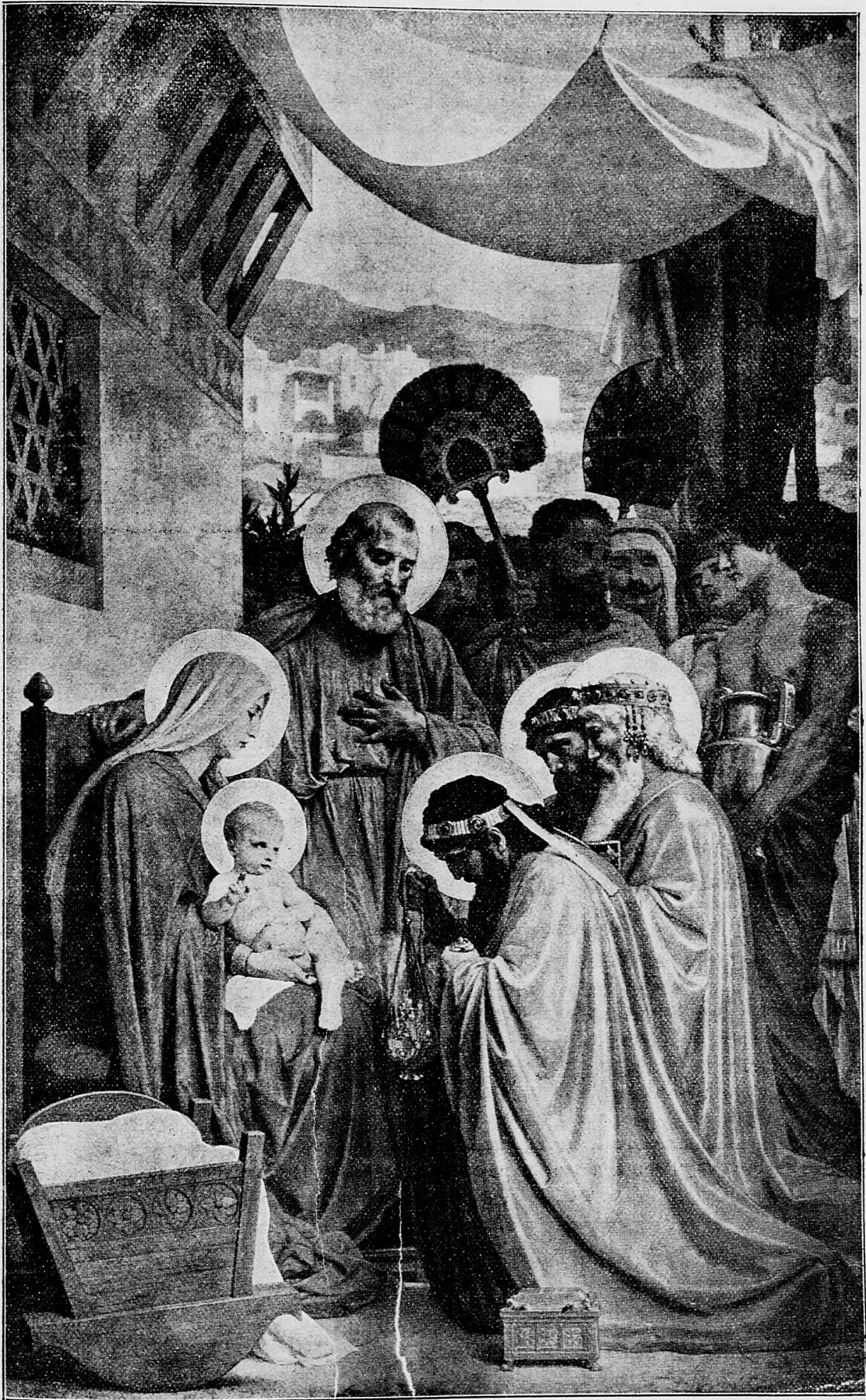
☞ Poklona třech Mudrců od Východu.