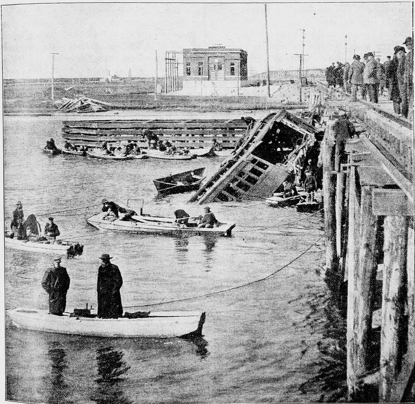
Nešťastie na železnici.

Budapest, IV. ker., Ferencz-József-rakpart 27. szám. sem sa majú posielat' predplatky, jako dopisy do novin ohlášky a náhodné reklamácie. Cena jedneho 5 stĺpcového nonpareill riadku 80 hl. Rukopisy sa naspak nedávajú.