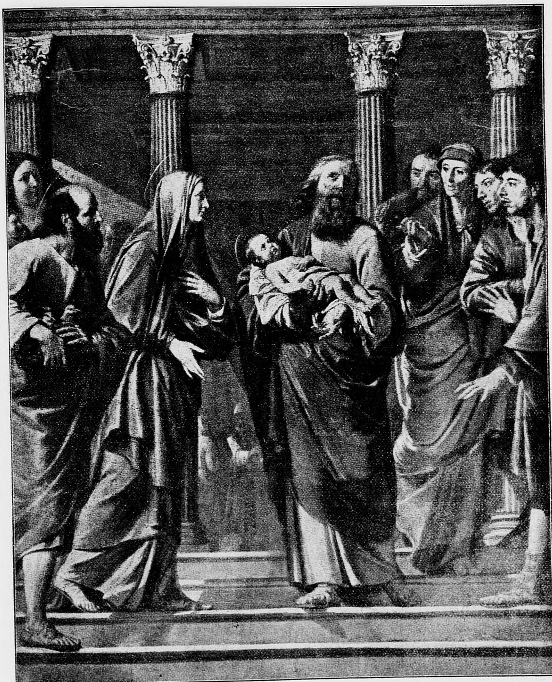
Predstavenie Ježiška v chráme.

sem sa majú posielat' predplatky, jako dopisy do novin ohlášky a náhodné reklamácie. Cena jedneho 5 stĺpcového nonpareill riadku 30 hl. Rukopisy sa naspak nedávajú.